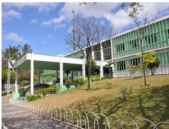
Contagem-MG realiza concurso para procurador municipal