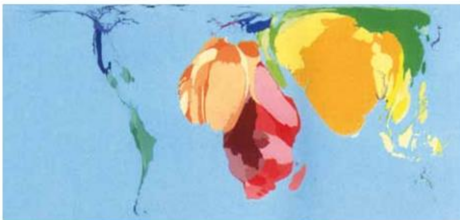
MORTALIDADE INFANTIL (DADOS DE 2002 QUE COMPUTAM A MORTE NO PRIMEIRO ANO DE VIDA)