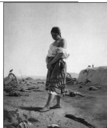
Fonte: Juan Manuel Blanes, A destruição causada pela guerra , 1880.

Essas duas pinturas se referem à chamada Guerra da Tríplice Aliança (ou Guerra do Paraguai), ocorrida na América do Sul entre 1864 e 1870.