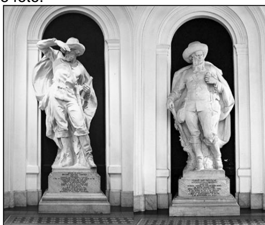
Fonte: Imagens das estátuas de Antônio Raposo Tavares [esq.] e Fernão Dias Pais [dir.], existentes no salão de entrada do Museu Paulista, São Paulo.