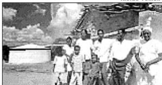
Revista Globo Rural, setembro, 2003.

O reservatório citado tem altura aproximada de 1,8 metro e capacidade para armazenar 16000 litros da água da chuva. Considerando R o raio da base do reservatório, pode-se afirmar que R^2 , em metro quadrado, é aproximadamente: