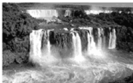
Cataratas do Iguazu