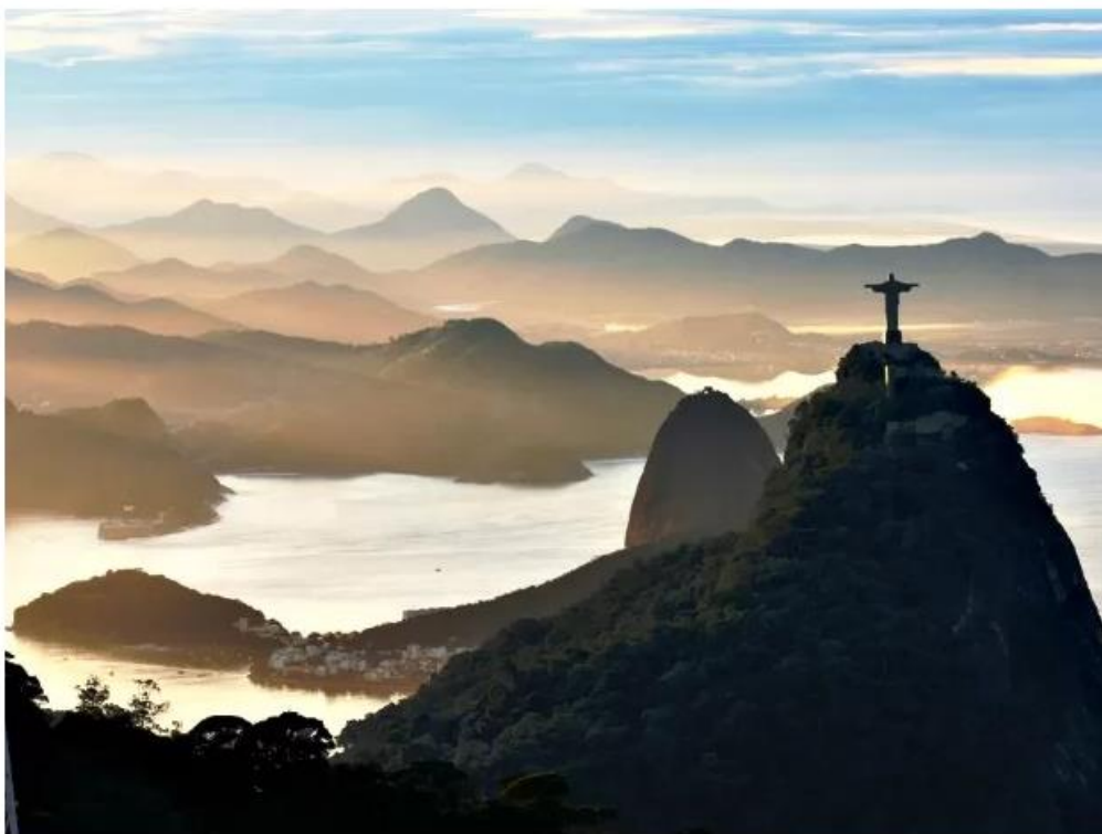
Rio de Janeiro se torna Patrimônio Cultural da Humanidade

Rio de Janeiro: Primeira cidade do mundo a receber o título como Paisagem Cultural Urbana