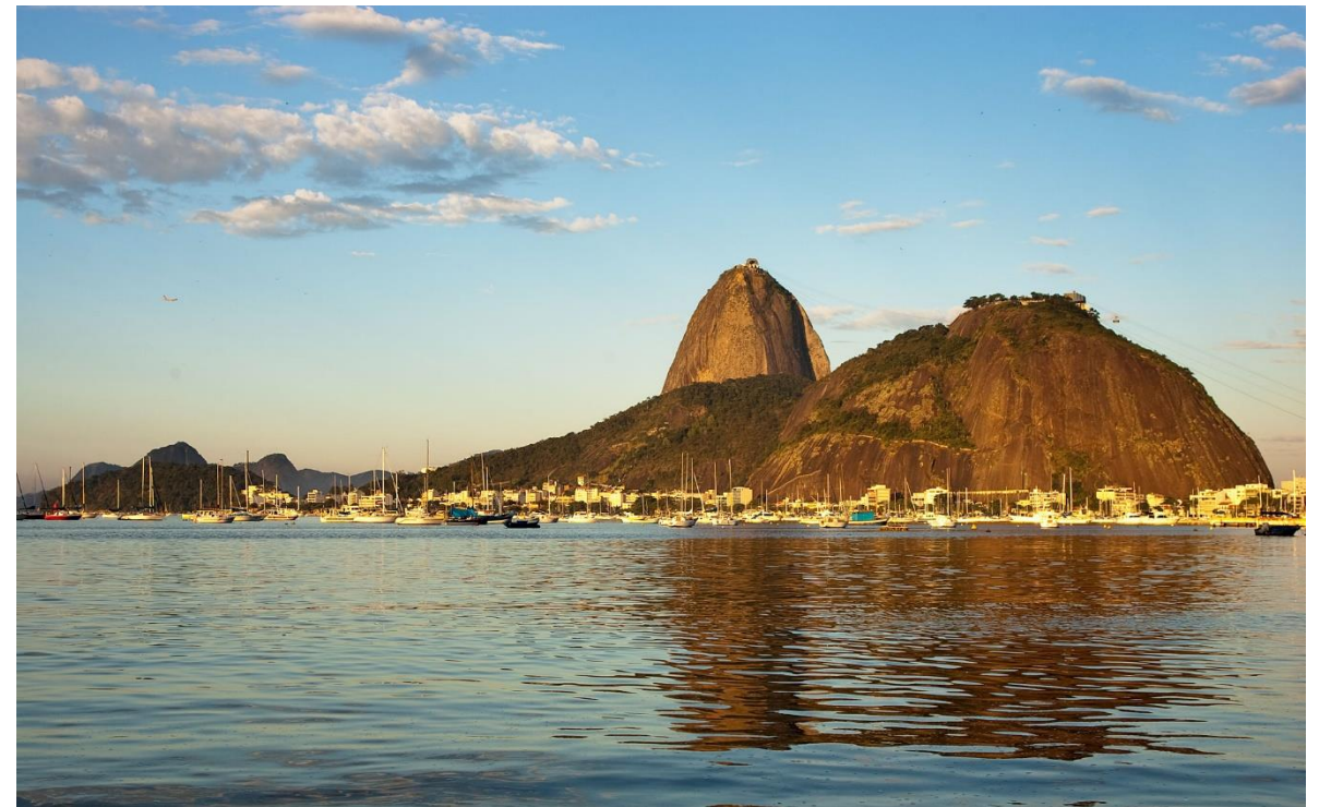
Pão de Açúcar