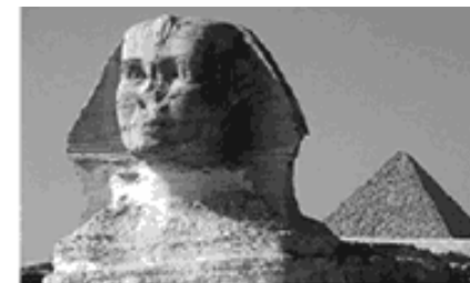
Esfinje de Gizé