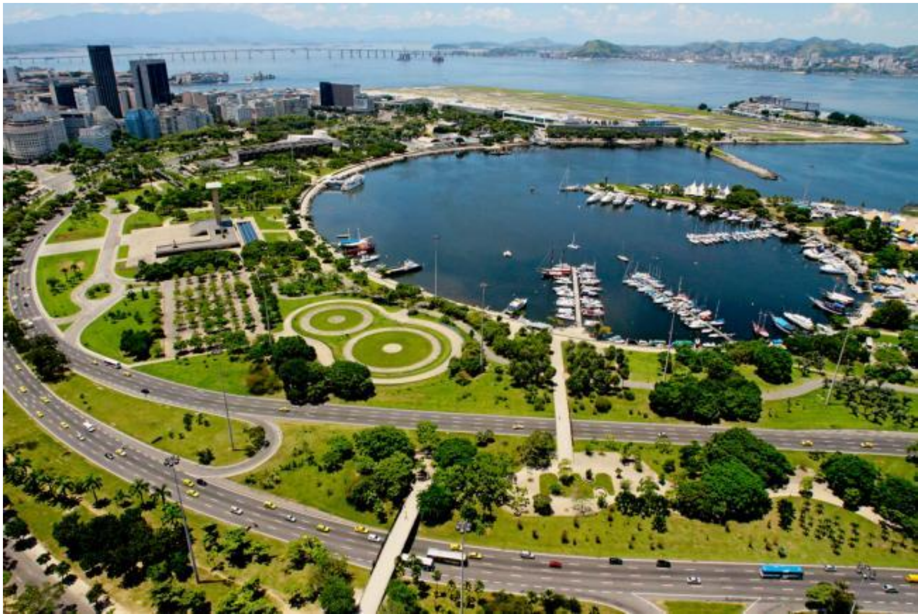
Aterro do Flamengo