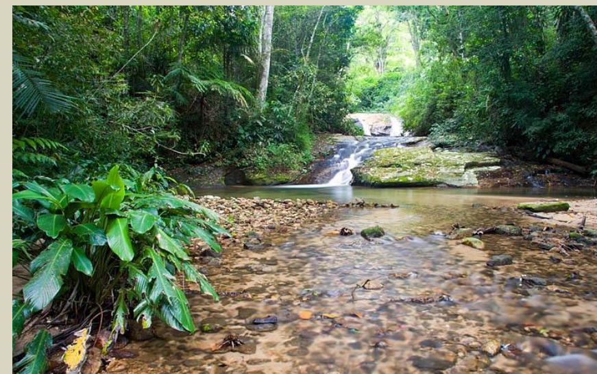
Floresta da Tijuca