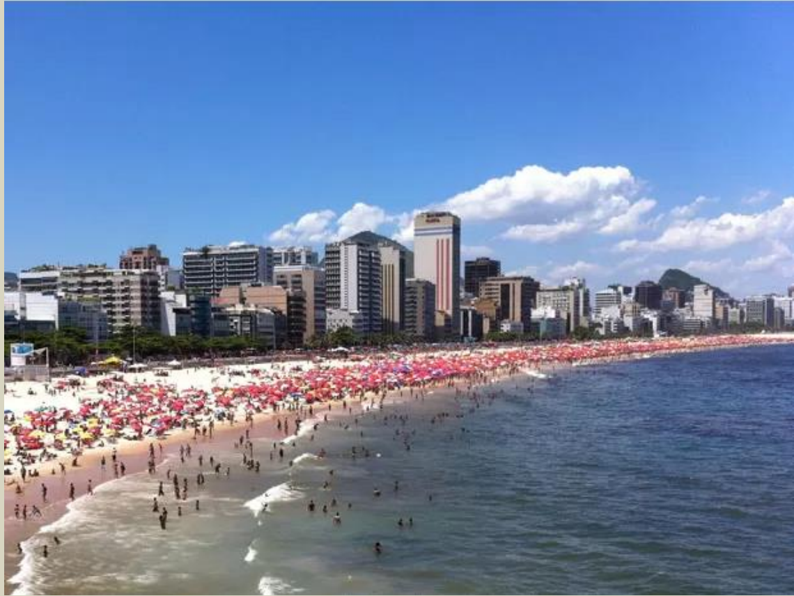
Praia de Copacabana