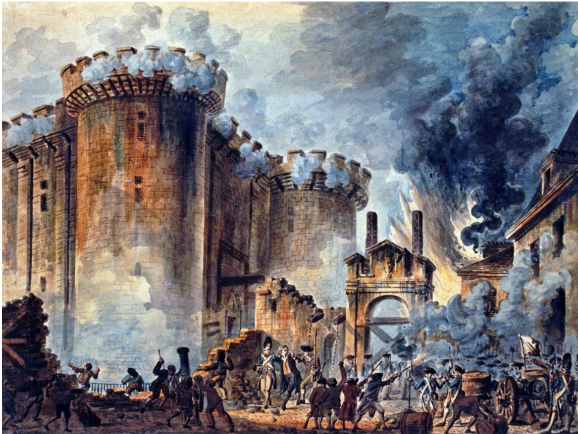
Queda da Bastilha