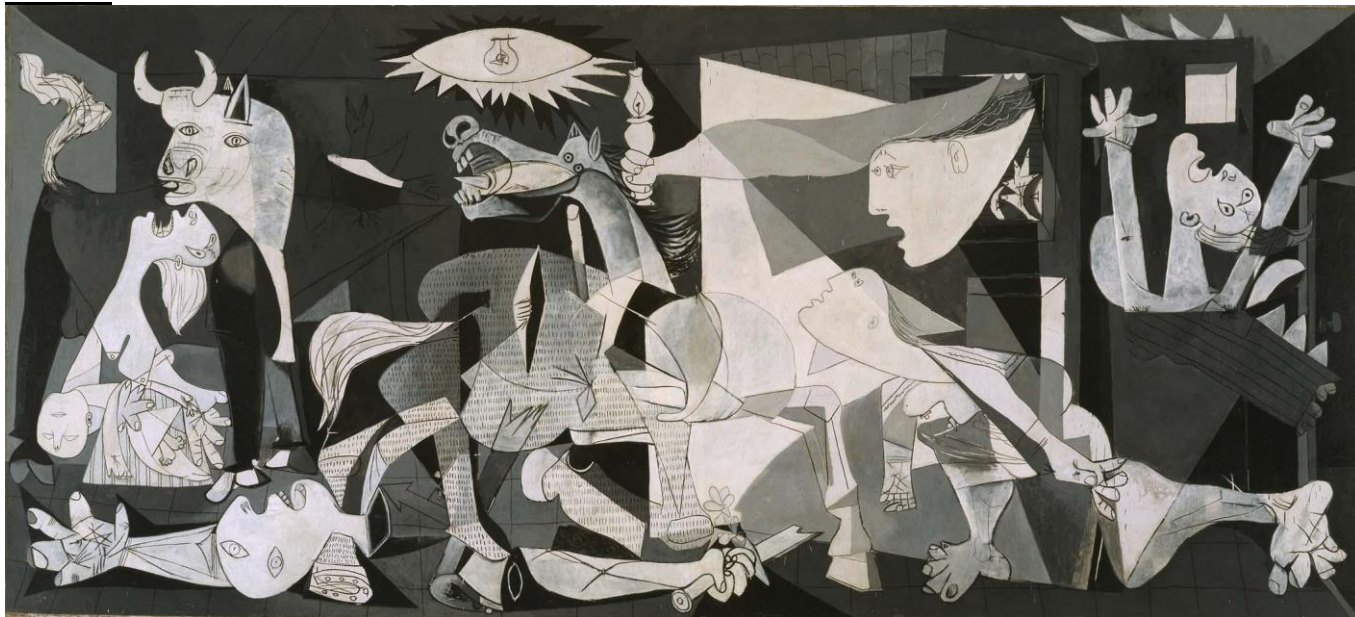
(Guernica, Pablo Picasso)