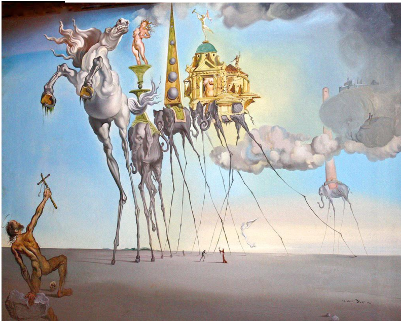
(A tentação de Santo Antônio, Salvador Dalí)