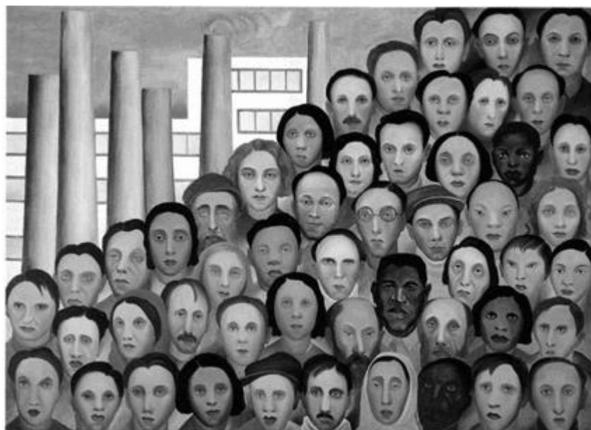
Quadro Operários, de Tarsila do Amaral, 1933. Óleo sobre tela 150 x 205 cm. Acervo Artístico-Cultural dos Palácios do Governo do Estado de São Paulo. Coleção Governo do Estado de São Paulo.

5. (MACKENZIE-2008) Observe o quadro abaixo.