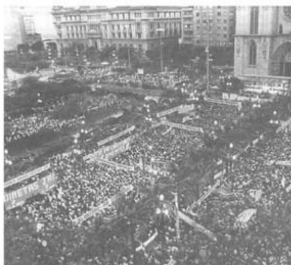
Comício pelas Diretas Já, em São Paulo, 1984.

Tema da redação do ENEM 2002.