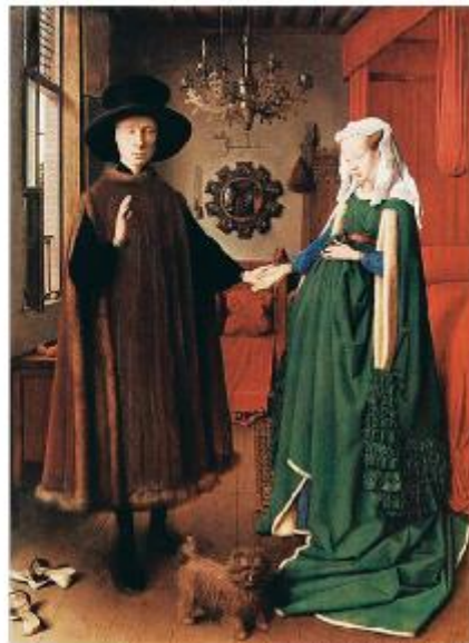
JAN VAN EYCK (1389-1441)