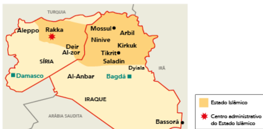
MAPA DOS TERRITÓRIOS OCUPADOS PELO ESTADO ISLÂMICO