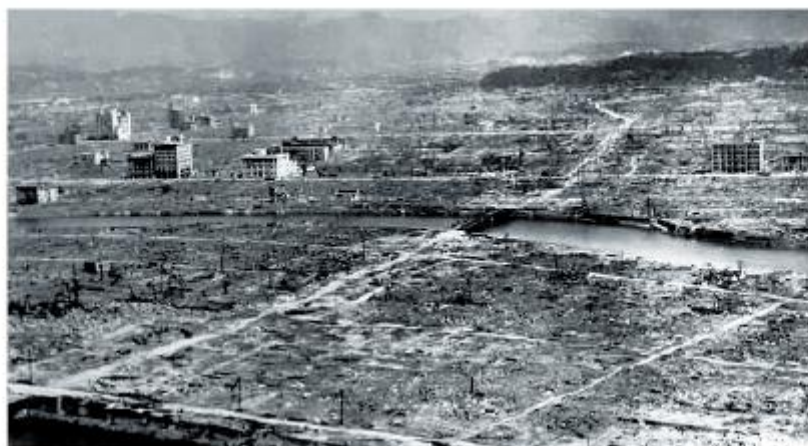
Cidade de Hiroshima após o lançamento da bomba atômica em 6 de agosto de 1945