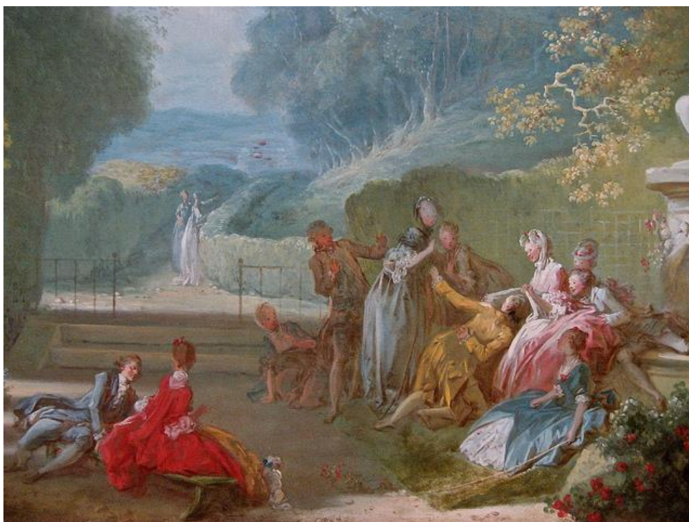
A game of hot cockles, de Fragonard, exemplo de como a vida natural ganhou projeção no século XVIII.

Arcadismo é o nome que se dá ao movimento cultural que sucedeu o Barroco no século XVIII.