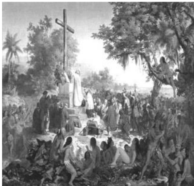
Primeira Missa no Brasil – Victor Meirelles (1861) Disponível em: http://www.moderna.com.br . Acesso em: 3 nov. 2008.

carta de Pero Vaz de Caminha. Enquanto a primeira retrata fielmente a carta, a segunda – ao excluir a natureza e os índios – critica a narrativa do escrivão da frota de Cabral. Além disso, na segunda, não se vê a cruz fincada no altar.