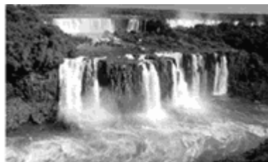
Cataratas do Iguaçu