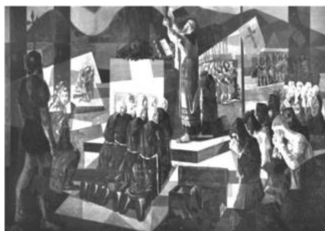
Primeira Missa no Brasil – Cândido Portinari (1948) Disponível em: http://www.casadeportinari.com.br . Acesso em: 3 nov. 2008.

Ao comparar os quadros e levando-se em consideração a explicação dada, observa-se que