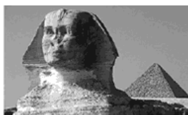
Esfinje de Gize