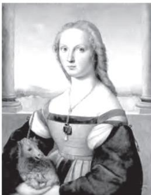
SANZIO, R. (1483-1520) A mulher com o unicórnio. Roma, Galleria Borghese. Disponível em: www.arquipelagos.pt. Acesso em: 29 fev. 2012.

CAMÕES, L. Obra completa. Rio de Janeiro: Nova Aguilar, 2008.