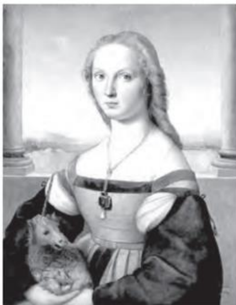
SANZIO, R. (1483-1520) A mulher com o unicórnio. Roma, Galleria Borghese. Disponível em: www.arquipelagos.pt. Acesso em: 29 fev. 2012.

CAMÕES, L. Obra completa. Rio de Janeiro: Nova Aguilar, 2008.