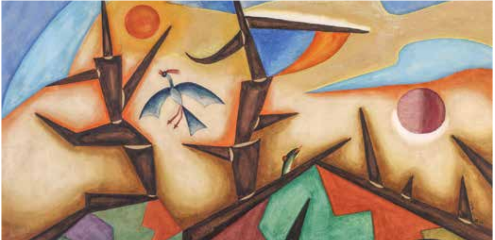
Xul Solar: Troncos, 1919

Un nuevo recorrido por el arte latinoamericano del siglo XX, a partir de las obras emblemáticas del patrimonio del museo. La exposición reúne 240 piezas de más de 200 artistas y destaca la riqueza artística y cultural del período moderno en América Latina, uno de los mejor representados en la Colección Malba.