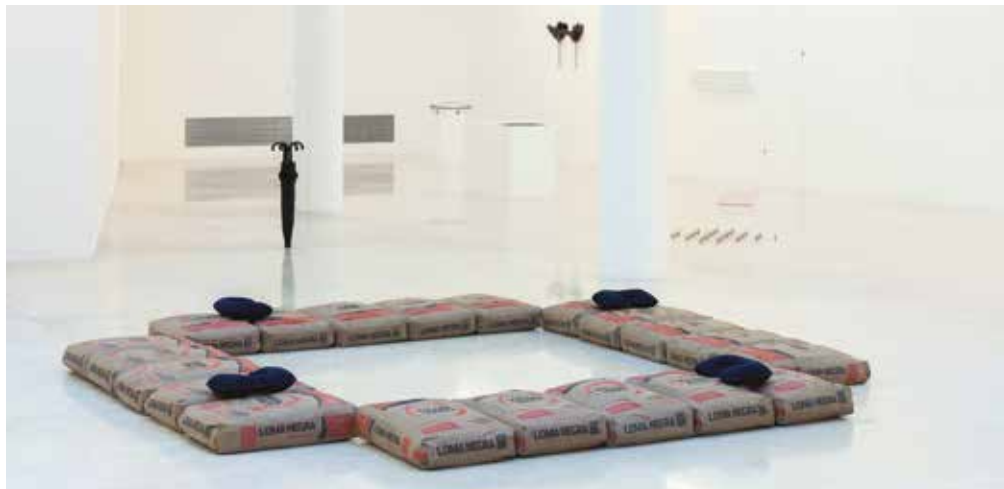
Pablo Accinelli. Nubes de paso (vista de sala). 2018