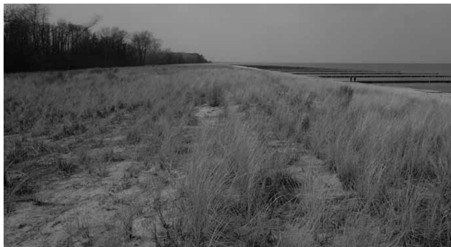
Fig. 1.2 Duna de proteção nas proximidades de Koserow, Mecklenburg-Vorpommern (Alemanha), mostra a natureza linear da duna e seu contato abrupto com o reflorestamento na direção continental