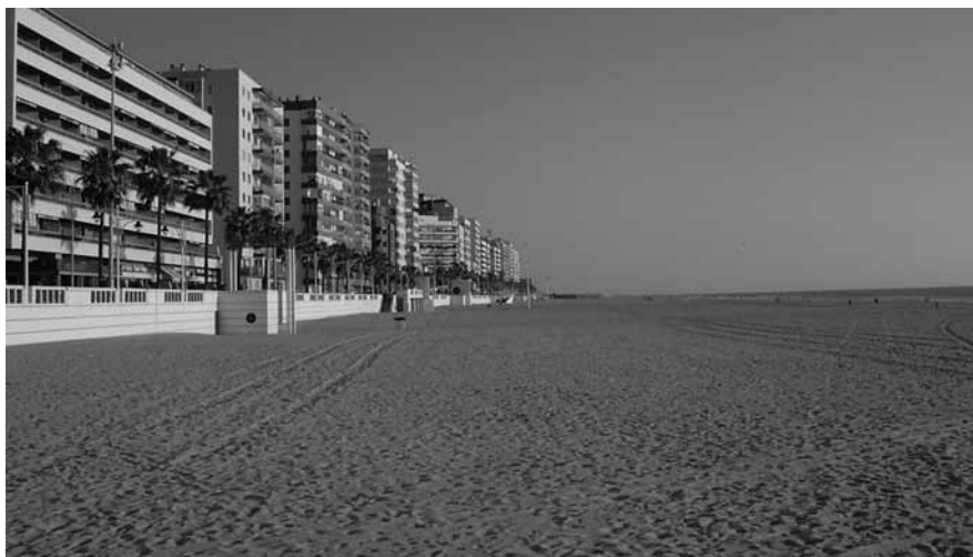
Fig. 1.1 Praia de La Victoria, em Cádiz (Espanha), mostra monotonia de topografia e de vegetação numa praia engordada que é conservada e limpa para recreação

converter paisagens distintas em diferentes partes do mundo numa única paisagem de turismo, que simula componentes considerados eficazes em atrair turistas, o que dilui a particularidade geográfica e a identidade do terreno.