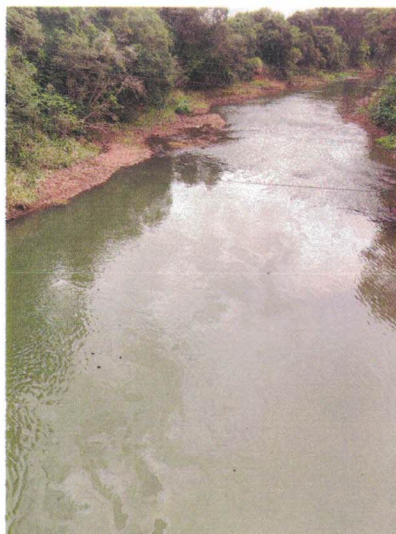
Foto 01: Fotografia de mancha no rio. Coordenadas geográficas: 29°33'35.09"S, 50°47'19.25"O.

Durante a fiscalização, também foi verificado que o ocorrido não causou danos aos animais ou à vegetação do local, visto que, de forma visível, não foram constatados espécimes afetados. Reitera-se que o Município trata com extrema prioridade e rigor todas as demandas voltadas à preservação ambiental, mantendo a vigilância constante para garantir a proteção dos nossos recursos naturais e o pronto atendimento a qualquer chamado dessa natureza.