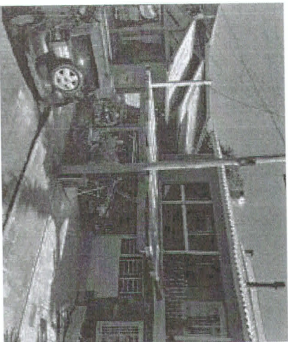
poste José 2 Dallarosa 101.PNG 1.7 MB