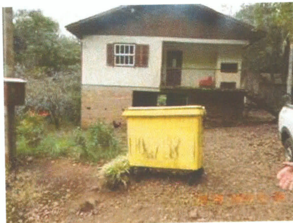
Imagem 1: Vista do container instalado