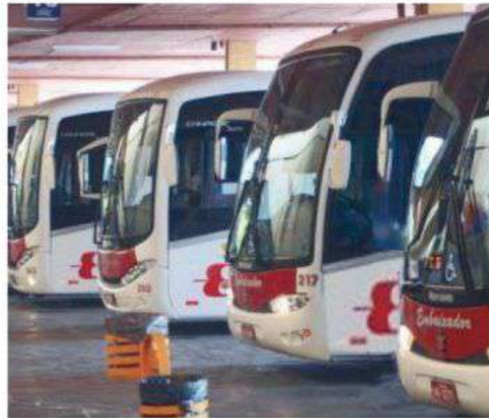
CARRO do Embaixador parado não significa motorista liberado: motoristas têm de cuidá-los

Mesmo quando dizem, em Rio Grande, que os motoristas não precisam ficar na Rodoviária, que podem sair, os gestores não