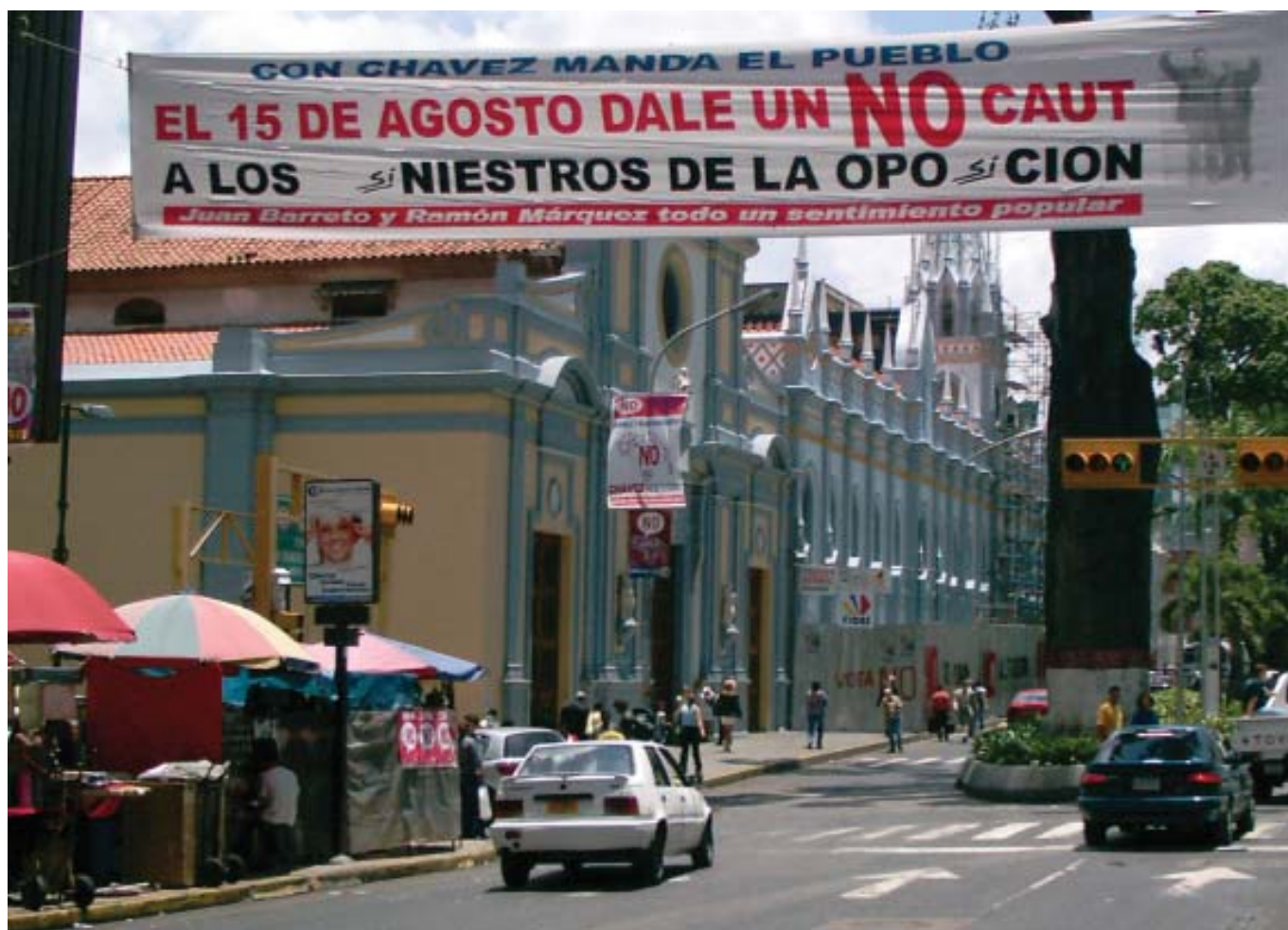
O plebiscito de 15 de agosto mostrou uma profunda divisão de classes na Venezuela