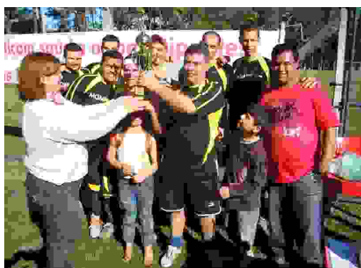
Futebol - Chave dos Perdedores 1º lugar: Monfort R$ 200,00 e troféu