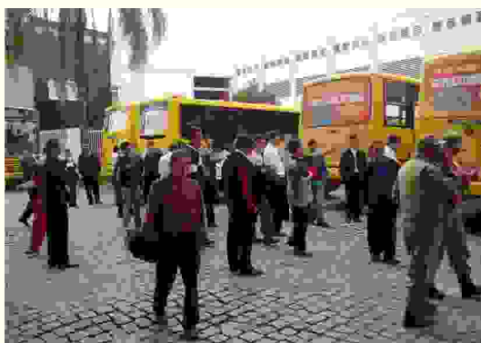
Motoristas e cobradores pararam de 14 a 16 de setembro

Os motoristas e cobradores da Canarinho demonstraram força e coragem na greve que durou três dias e que repercutiu em toda a região. Volta ao trabalho aconteceu porque a empresa readmitiu dois motoristas demitidos depois de um acordo de estabilidade de 90 dias, firmado ao final da primeira greve, em agosto. A paralisação, a segunda em menos de um mês, teve apoio do Siticom.