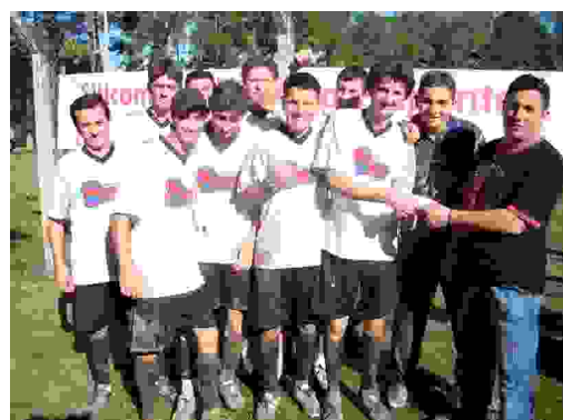
Futebol - Chave dos Perdedores 2º lugar: Móveis JAE R$ 150,00