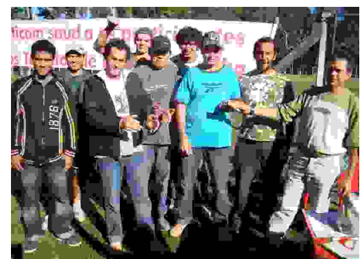
Futebol - Chaves dos Ganhadores 3º lugar: EMME Coopercasa - R$ 150,00