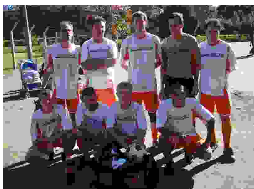
Futebol - Chave dos Ganhadores: 1º lugar: Projemoveis – R$ 250,00, mais troféu

Siticom agradece e parabeniza as 20 equipes participantes dos Torneios de Futebol e Bocha, realizados dia 12 de julho e que reuniu centenas de trabalhadores na Recreativa da Menegotti, em confraternização. Confira nesta edição a relação das equipes vencedoras.