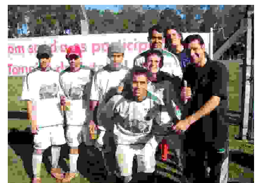
Futebol - Chave dos Perdedores 3º lugar: MFT R$ 100,00