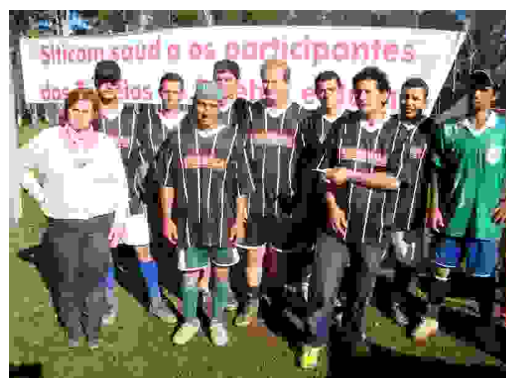
Futebol - Chaves dos Ganhadores 2º lugar: Anjos dos Santos - R$ 200,00