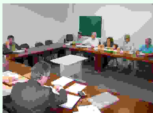
Negociações de data-base, com sindicato patronal, ocorreram no Centro Empresarial e na sede do Siticom

Os salários Admissional e Normativo da categoria tiveram aumento real de 2,43% acima da inflação, ou seja, de 7%. Com aprovação do piso estadual de salário, que passa a vigorar a partir do ano que vem, a diretoria do Siticom volta a negociar em janeiro do próximo ano, já que o Normativo da categoria ficou abaixo do piso estadual de salário (veja matéria ao lado).