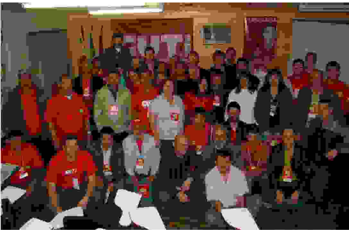
Dirigentes que participaram da Plenária da Fetracom, em Jaraguá do Sul