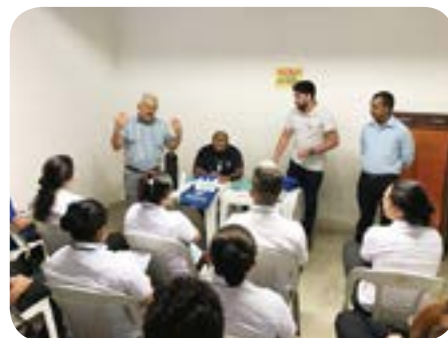
Supermercado Cometa - 15 de Maio