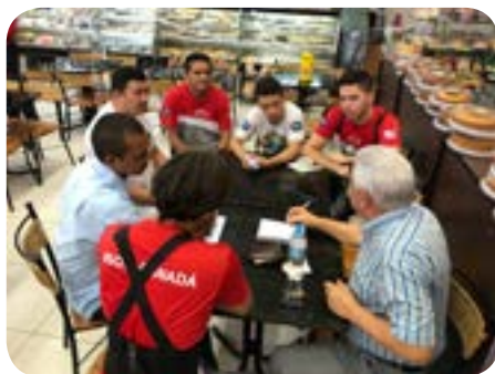
Supermercado Canadá - 15 de Maio