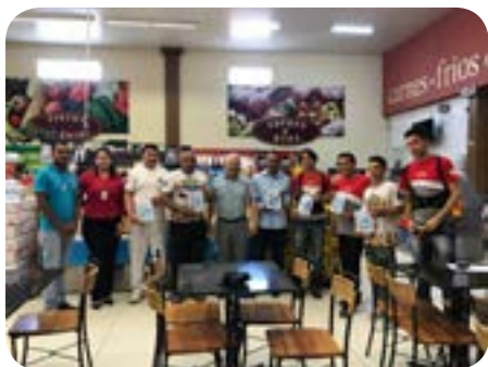
Supermercado Canadá - 15 de Maio