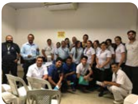
Supermercado Cometa - 15 de Maio