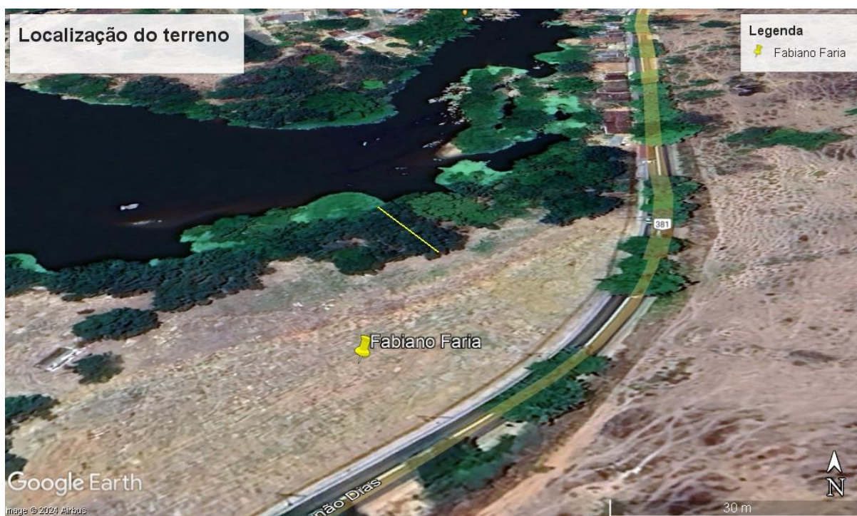
Figura 8. Trecho de área preservada no terreno.

Ainda é possível afirmar através da análise de imagens aéreas que não houve supressão de vegetação nativa por parte do proprietário, ademais foi realizado por parte do mesmo a recuperação ambiental de uma faixa de fragmento florestal, que gira em torno de 15 metros de extensão ao longo do terreno, conforme observa-se na figura 8.