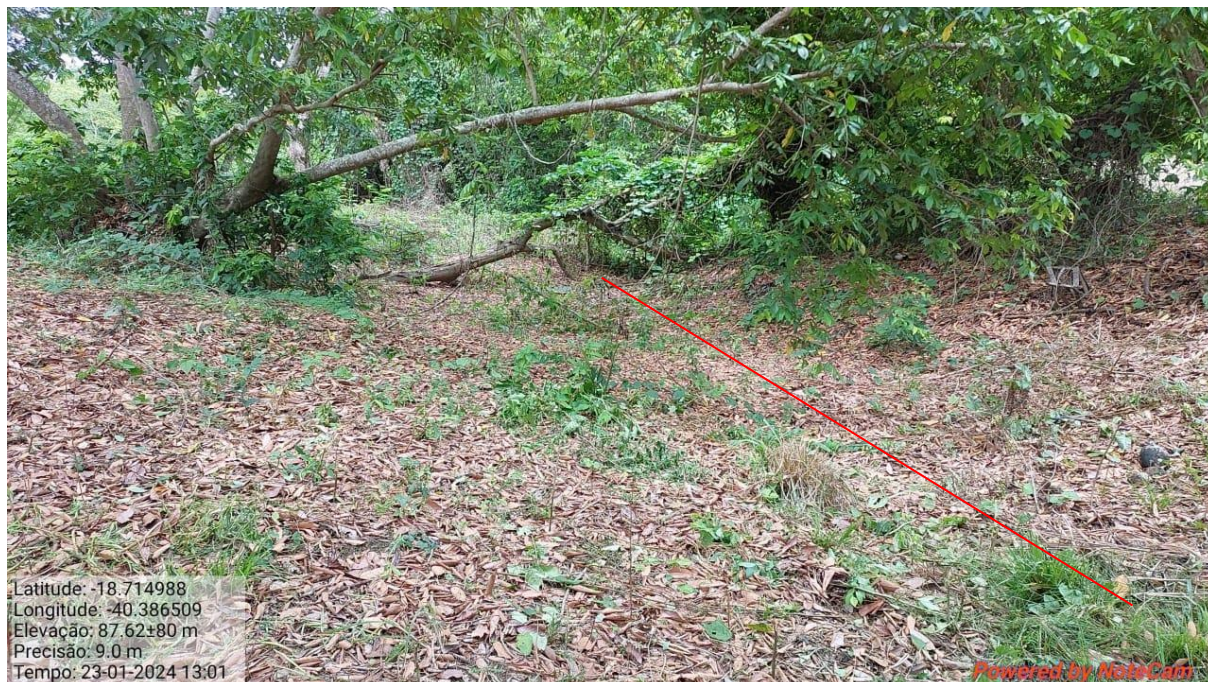
Figura 11. Área de Drenagem natural do terreno.

A drenagem é o fator primordial para a captação de águas pluviais e para a proteção dos taludes jusantes contra processos erosivos. Considerando que ao longo dos anos o requerente realizou a preservação da faixa de drenagem natural do terreno, é válido que com a vegetação em um período de cheias a água seja infiltrada lentamente no solo e direcionada para os canais do rio sem causar prejuízos estruturais no solo e reduzindo o risco de aumentar a área de alagamento.