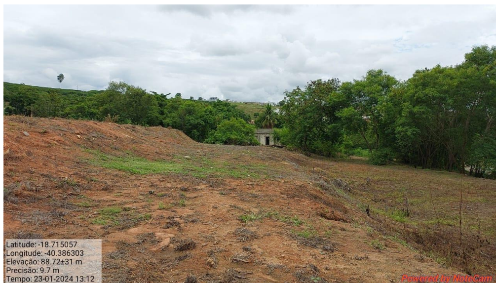
Figura 7. Aterro indicando terraplanagem executada.

Ainda é possível afirmar através da análise de imagens aéreas que não houve supressão de vegetação nativa por parte do proprietário, ademais foi realizado por parte do mesmo a recuperação ambiental de uma faixa de fragmento florestal, que gira em torno de 15 metros de extensão ao longo do terreno, conforme observa-se na figura 8.