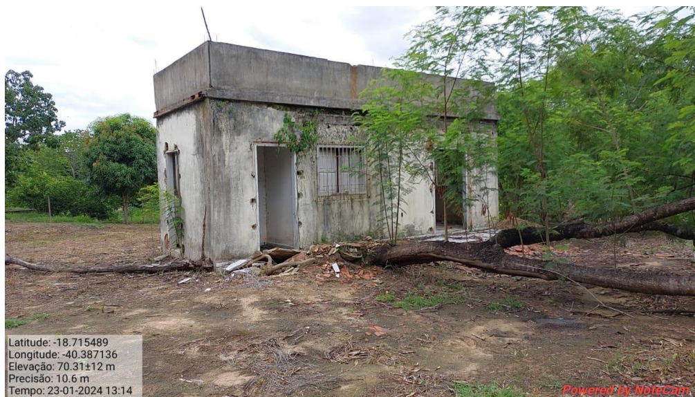
Figura 6. Construção de alvenaria.

Em levantamento de campo e vistoria in loco foi possível constatar a execução da atividade de terraplanagem, corte e aterro no terreno, além de uma construção de alvenaria indicando ocupação da área, figura 6 e 7.