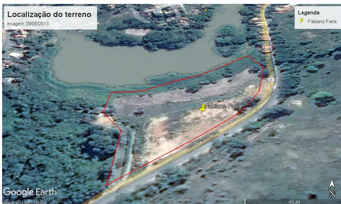
Figura 4. Imagem Georreferenciada do terreno em 29/05/2013.

Observa-se também as imagens georreferenciadas em 29/05/2013, onde mesmo após um período de chuva que até então foi a maior registrada nos últimos 20 anos, segundo consta nos autos do processo desde que começaram as medições pluviométricas há 100 anos atrás, o período chuvoso ocorrido em 2013 foi o maior volume de chuva de todos os tempos, mesmo assim não foi possível verificar alagamento na área do imóvel e nem mesmo aumento significativo dos fragmento de vegetação ao longo do rio, conforme visto na figura 4.