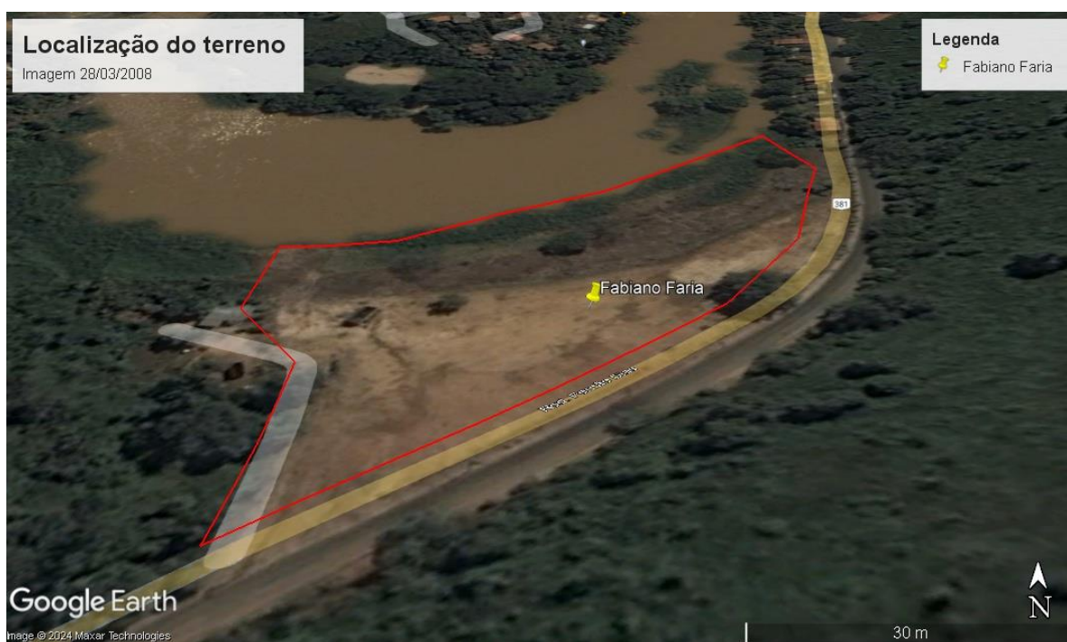
Figura 3. Imagem Georeferenciada do terreno em 28/03/2008.

Salienta-se que o proprietário adquiriu o terreno em meados dos anos 2000, pertencente há sua família há mais de 100 anos, sendo a área coberta por apenas pastagens, tal informação pode ser aferida por meio do Laudo de Vistoria emitido pelo IDAF em 14/10/2003 onde foi constatado a existência de pastagens e a inexistência de área coberta por vegetação nativa ( Processo SEMMA – Fls 253). Além disso tal informação pode ser confirmada através de análise histórica das imagens aéreas fornecidas pelo Google Eart Pro, onde foi possível constatar que em 2008 havia pouquíssimos fragmentos vegetais localizados as margens do Rio Cricaré, conforme visto na figura 3.