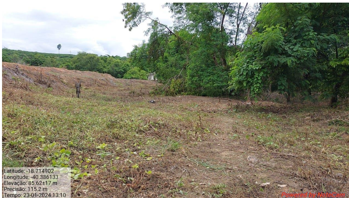
Figura 9. Trecho de área preservada no terreno.