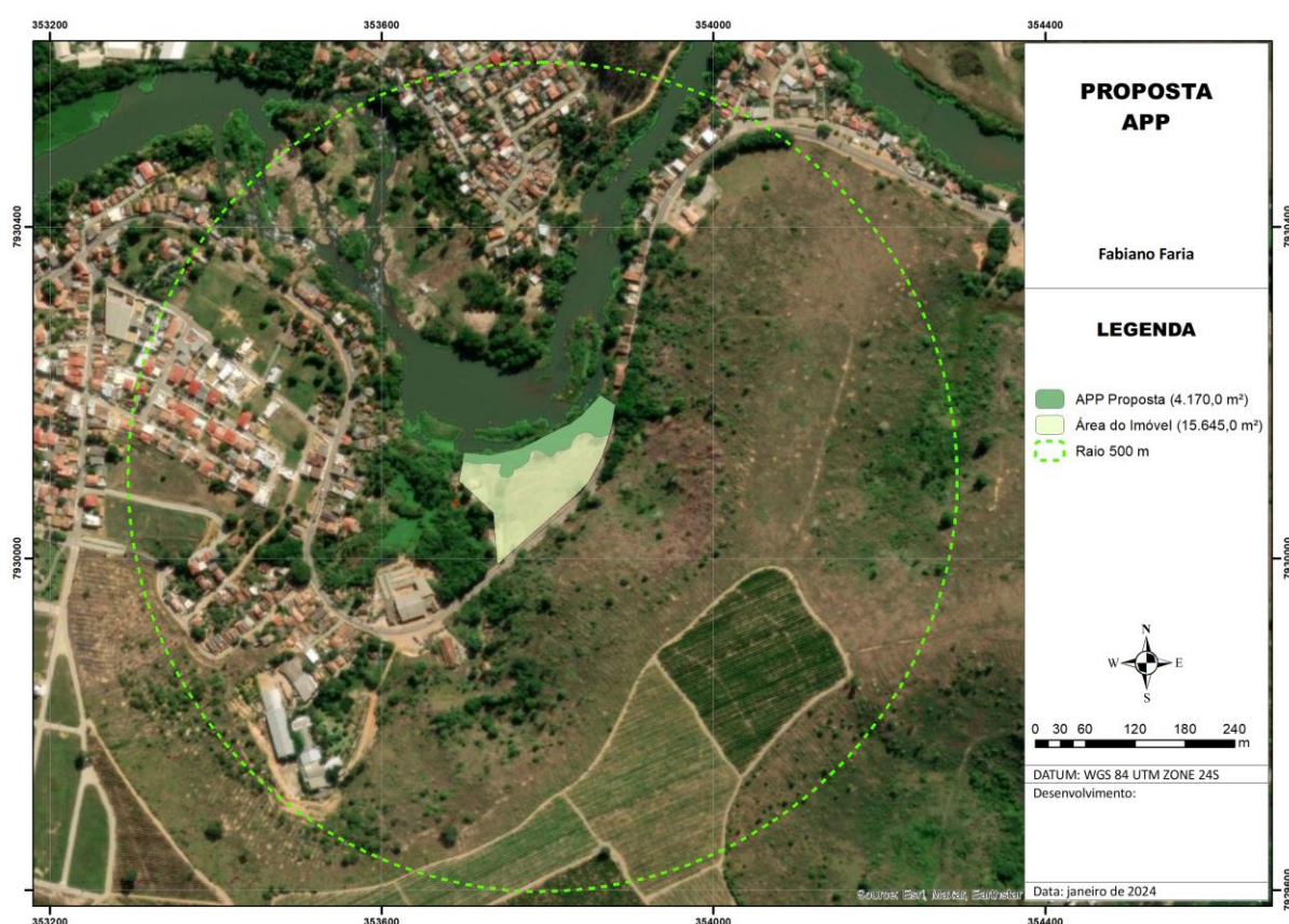
Figura 1. Mapa de localização e proposta de ocupação do terreno localizado em área urbana consolidada.

Ainda conforme o mapa a seguir, na área de influência direta do empreendimento no raio de 500 metros, foi possível identificar rodovias, áreas comerciais, industriais e áreas residenciais, conforme visto na figura 1.