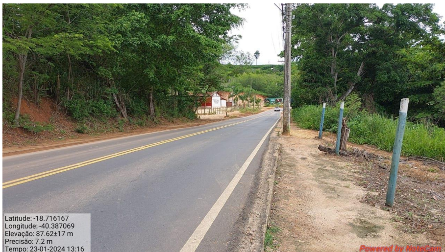
Figura 12. Sistema viária no entorno do terreno.