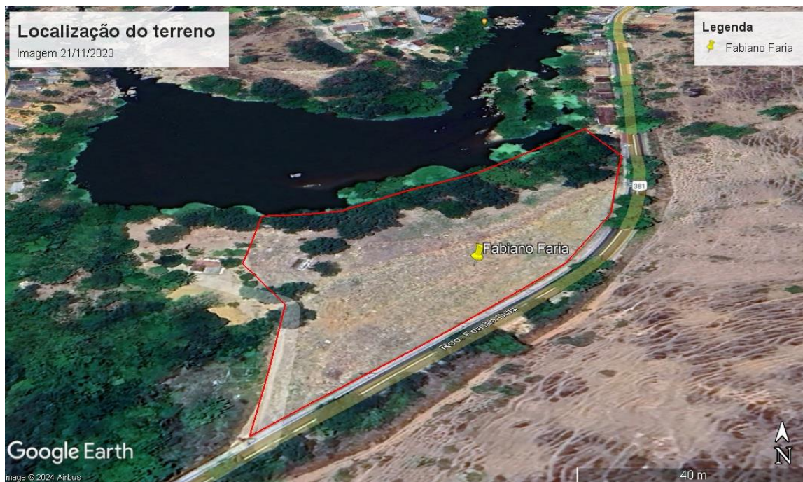
Figura 5. Imagem Georeferenciada do terreno em 21/11/2023.

No local alvo desta avaliação podemos verificar que ao longo dos anos de ocupação do terreno não foi possível constatar nenhuma função ambiental da Área de Preservação Permanente (faixa de 100 metros que seria determinado pela Lei nº 12.651/2012), indicando a utilização constante da área ao longo dos anos, seja como pastagem ou para o exercício de atividades econômicas, tomando ao seu lugar a função social da propriedade como fonte geradora de riquezas. Salienta-se que em 04/09/2003 foi emitida pelo IEMA Licença de Operação nº 069/2003 ( Processo Semma – Fls 36) para a atividade de extração de areia, o que atesta a utilização do solo com atividades econômicas passíveis de licenciamento ambiental.