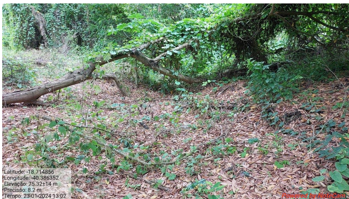
Figura 11. Área de Drenagem natural do terreno.