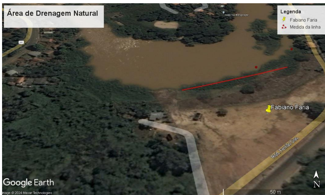
Figura 10. Área de drenagem natural do terreno e área de alagamento em período de cheia.

desta forma no período de cheias em uma faixa compreendida entre 05 a 15 metros toda a água é convergida novamente para o rio nos pontos indicados em vermelho.