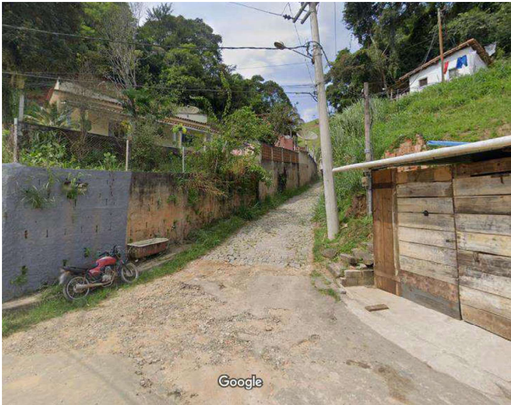
ACESSO AO LOGRADOURO