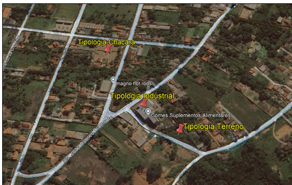
Imagem 3 – Área em marrom claro sendo referenciado como ZDE