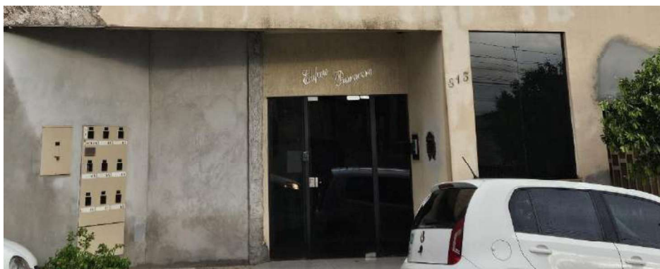
Imagem 02: Fachada do imóvel.