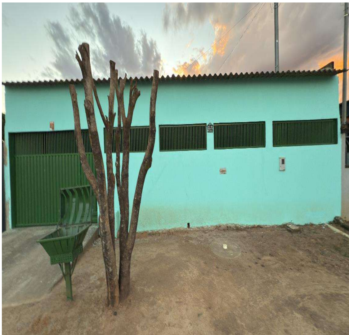
IMAGEM DO IMÓVEL AVALIADO

Loteamento JK, Quadra MOS, Lotes 07A e 07B, Luziânia/GO – CEP 72800-000 – Tel./Fax: (61) 3622 9400 – site: www.tjgo.jus.br