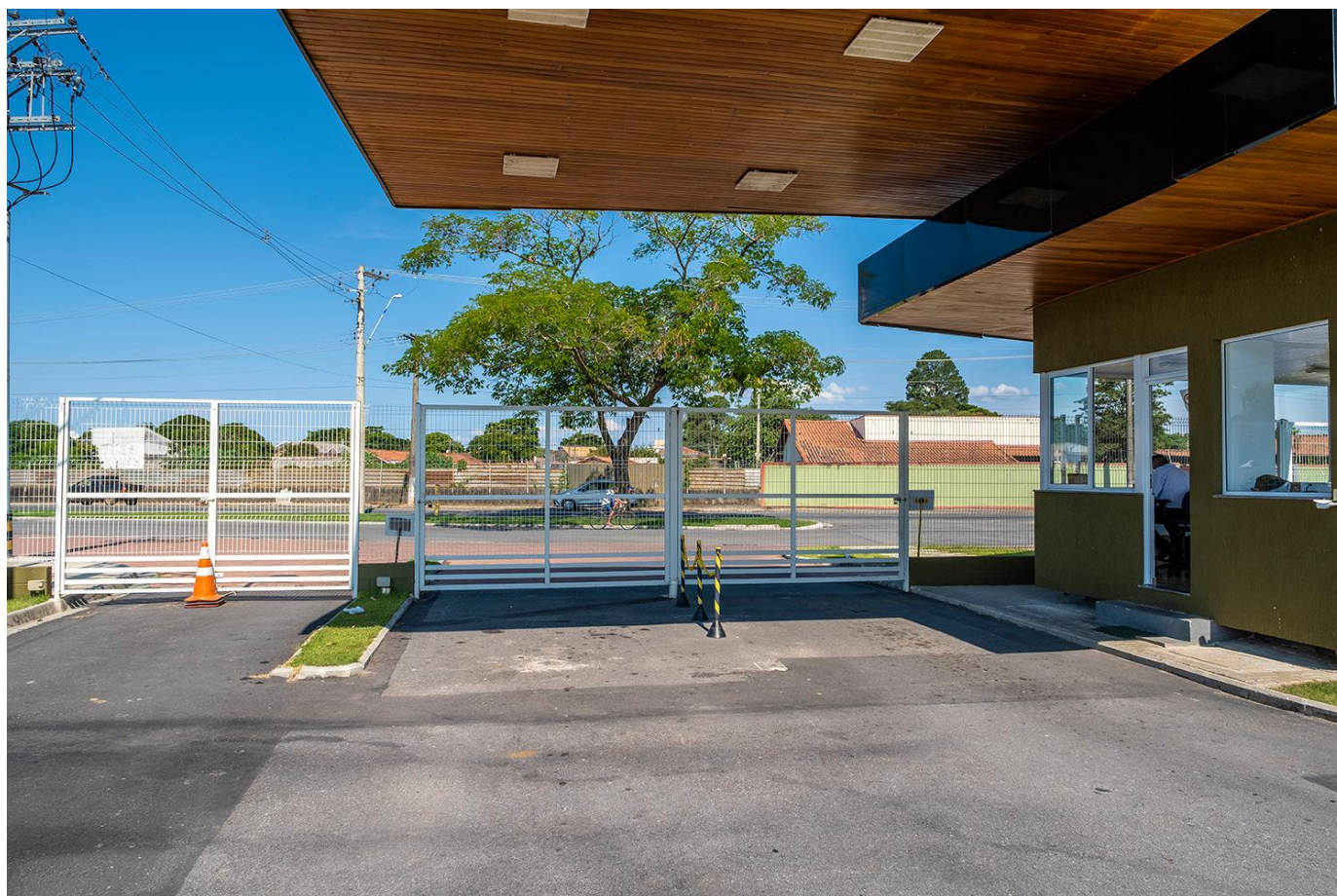
Área interna da entrada do condomínio