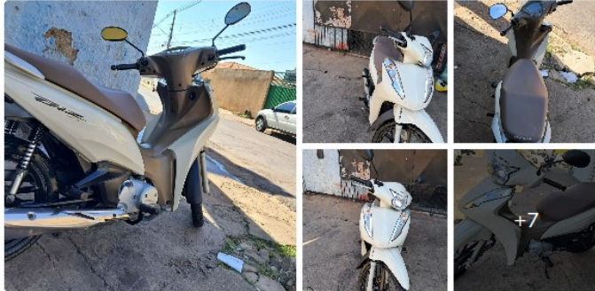
HONDA BIZ 125

Segue abaixo, algumas amostras de veículos do mesmo ano, modelo e em bom estado de conservação e funcionamento: