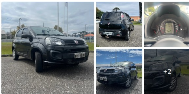
Uno drive 1.0 2018

Segue abaixo, algumas amostras de veículos do mesmo ano, modelo e em bom estado de conservação e funcionamento: