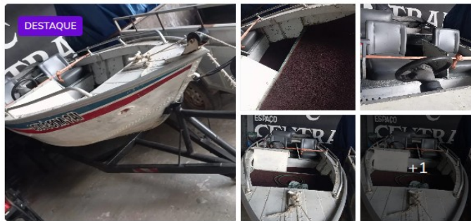
Barco completo motor Yamaha 40 Hp partida elétrica