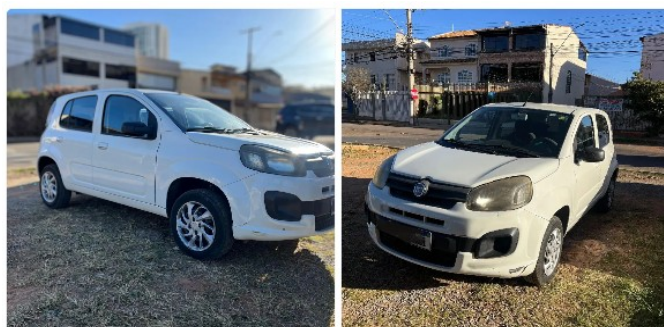
Uno drive 1.0 2017/2018