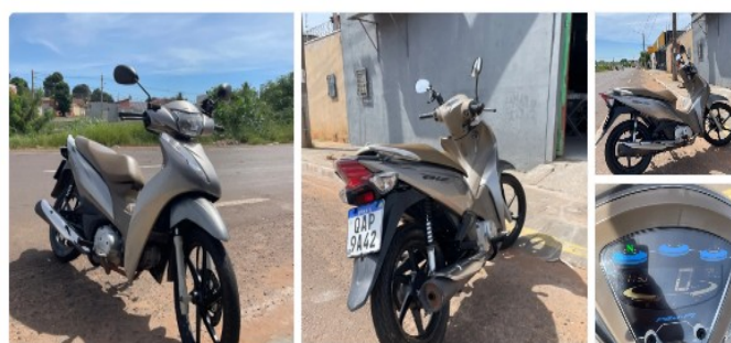
Honda biz 125