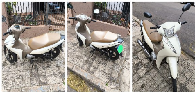
Honda Boz 125 ES