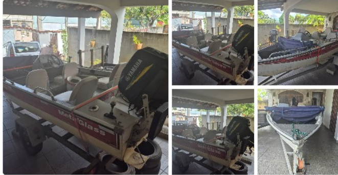
Barco com Motor Yamaha 40 HP

Segue abaixo, algumas amostras de embarcações similares a avaliando e em bom estado de conservação e funcionamento: