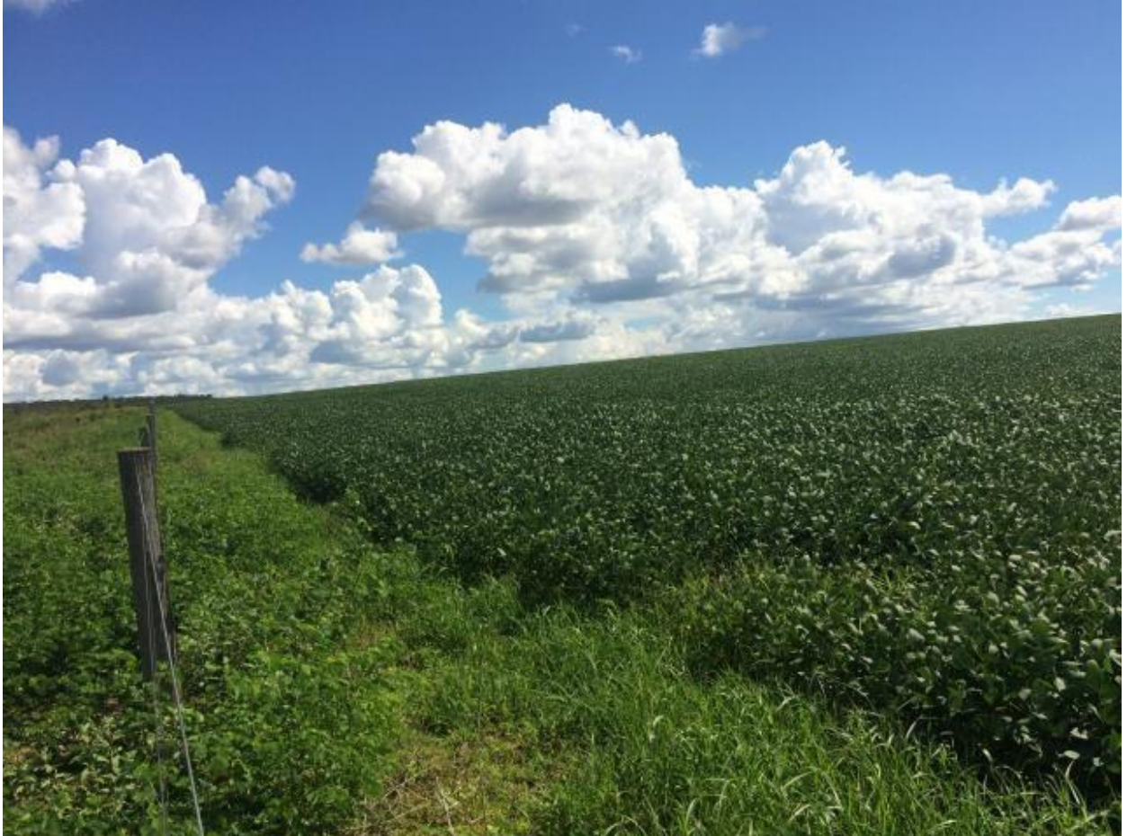
Imagem 4 - Foto baixa divisa de propriedade