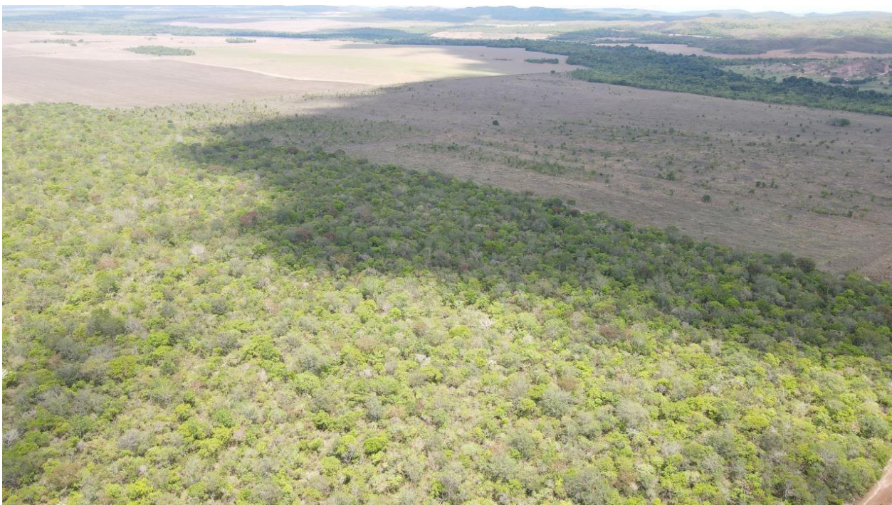
Imagem 2 - Foto aérea da propriedade área de reserva e pasto ao fundo