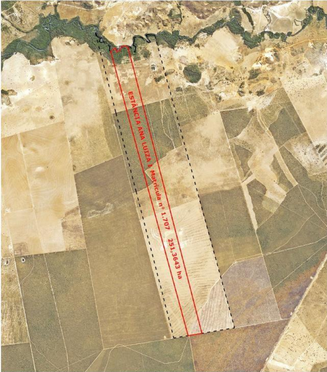
Mapa 1 - Área da propriedade