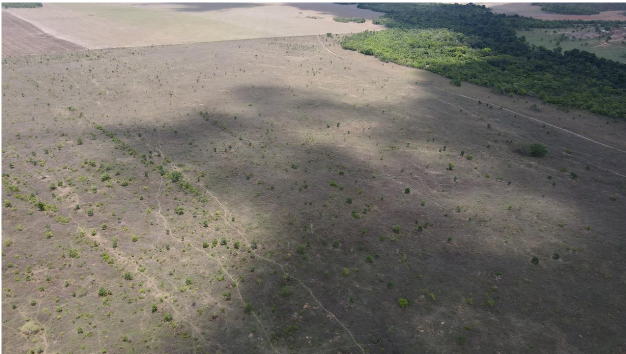
Imagem 1 - Foto Aérea da propriedade da área de pasto