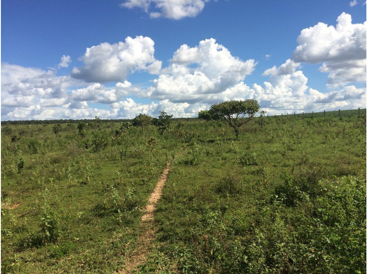
Imagem 3 - Foto baixa da pastagem