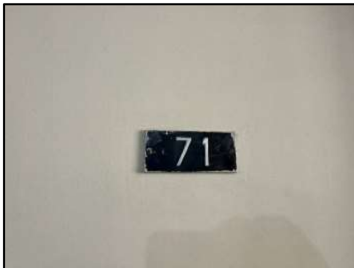
Foto nº 10: Vista em detalhe da identificação do apartamento 71 do “Edifício Marige”, ora avaliando.

Fotos nº 11 e 12: Vistas da cozinha e da área de serviços do apartamento 71, ora avaliando.