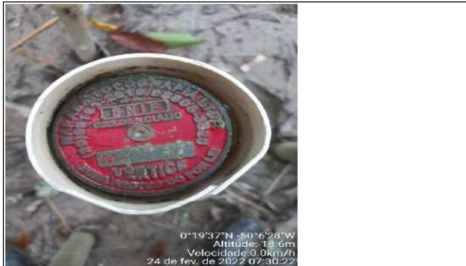
Foto 5 - Ponto de geo de divisória entre o Retiro Santo Antonio e seus visinho.

Laudo de avaliação de uso restrito do Banco da Amazônia S.A. elaborado conforme (NBR - 14.653-3, ) - não tem validade para outros usos ou exibição para terceiros.