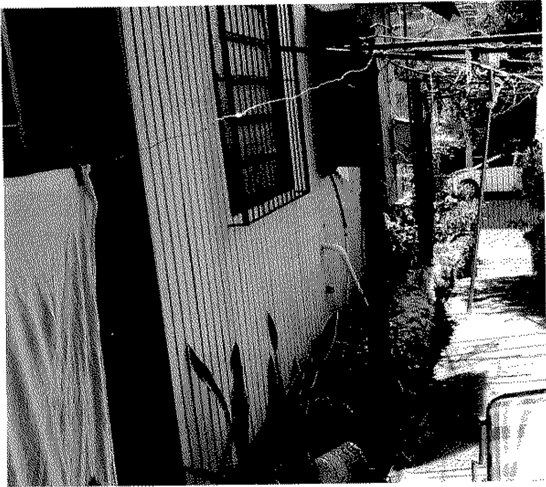
Área dos fundos do terreno