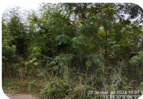
Vista frontal 13.304