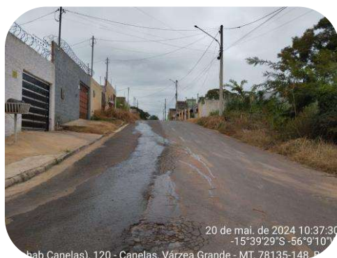
Acesso ao imóvel