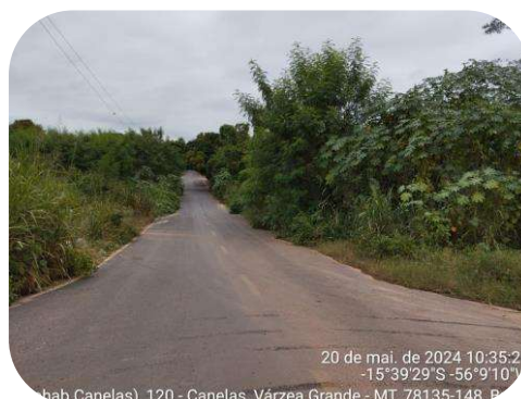
Acesso ao imóvel