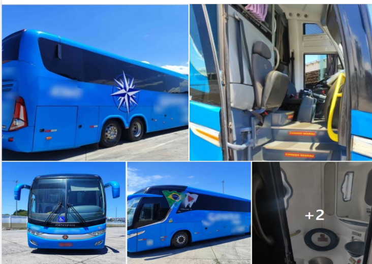
R$480.000 - MIGUEL PEREIRA, RJ 2014 MARCOPOLO paradiso g7 1200