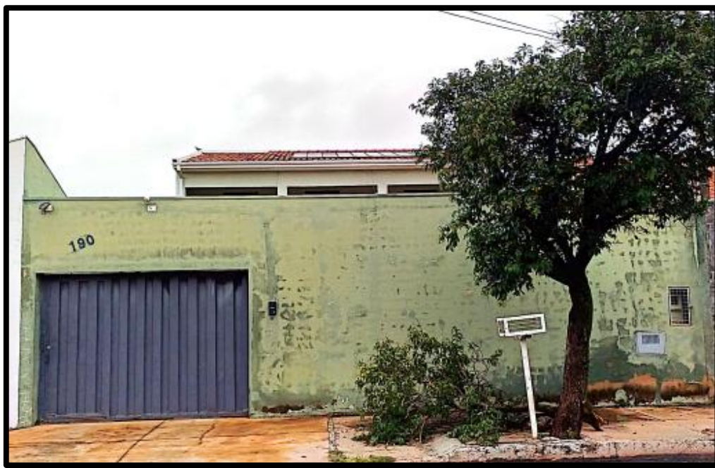
Foto da fachada do imóvel avaliado – Matrícula nº 9.535 do 1º Cartório de Registros de Imóveis de Araraquara