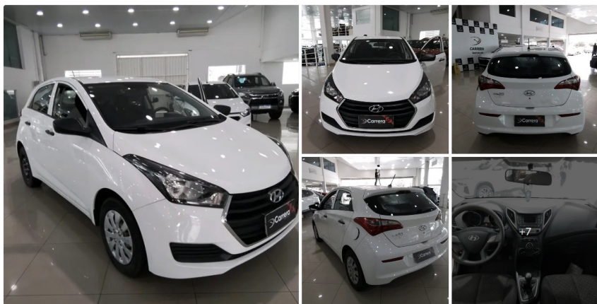
Hyundai HB20 Comfort 1.0 Flex 12V Mec. 2018