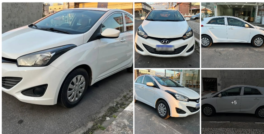
Hyundai HB20 Comfort Plus 1.0 TB Flex 12V Mec. 2018