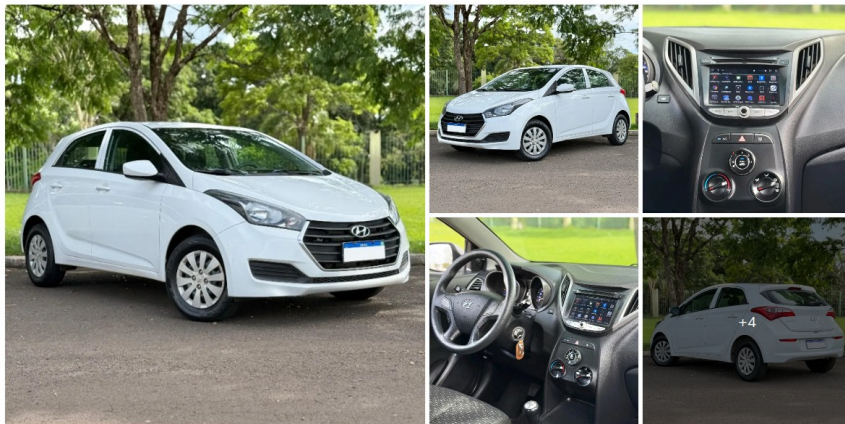
HB20 Comfort 1.0 - 2018

Segue abaixo, algumas amostras de veículos do mesmo ano, modelo e em bom estado de conservação e funcionamento: