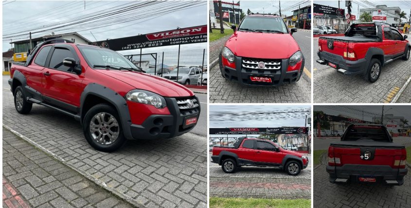
Fiat Strada Adventure1.8/ 1.8 Locker Flex CD 2011

Segue abaixo, algumas amostras de veículos do mesmo ano, modelo e em bom estado de conservação e funcionamento: