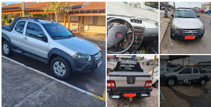
Fiat Strada Adventure1.8/ 1.8 Locker Flex CD 2011