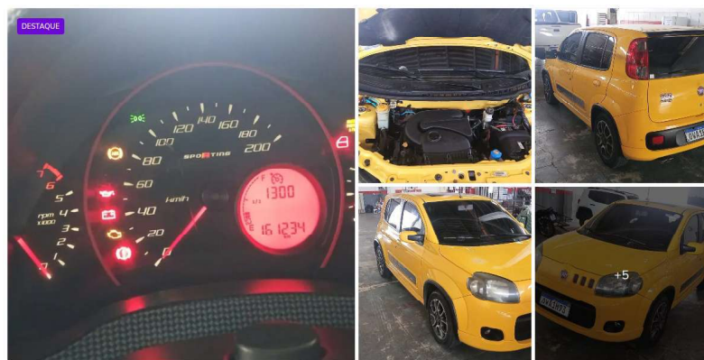
Fiat Uno Sporting 1.4 EVO Fire Flex 8V 4P 2014