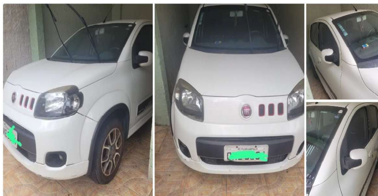
Fiat Uno Sporting 1.4 EVO Fire Flex 8V 4P 2014