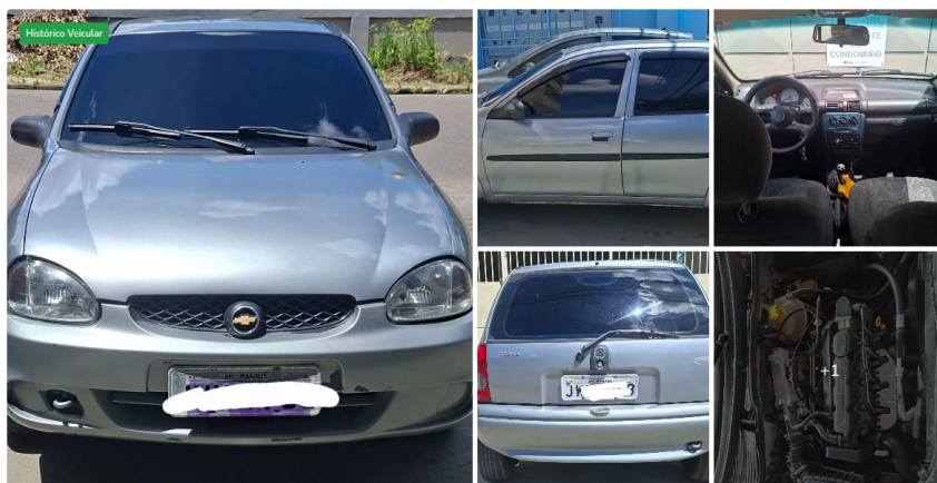
Chevrolet Corsa Wind 1.0 Mpf/millennium/EFI 4P (álcool) 2002