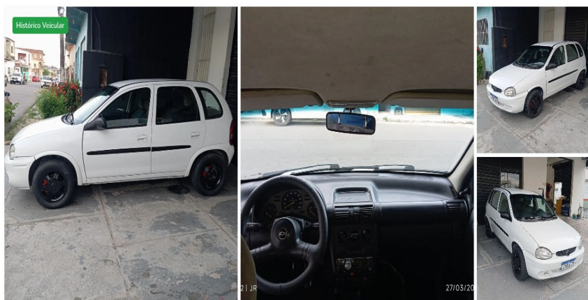
Chevrolet Corsa Wind 1.0 Mpf/millennium/EFI 4P (álcool) 2002