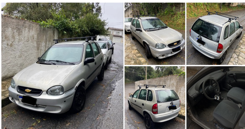
Chevrolet Corsa Wind 1.0 Mpf/millennium/EFI 4P (álcool) 2002

Segue, abaixo, a relação dos anúncios utilizados como base de comparação.