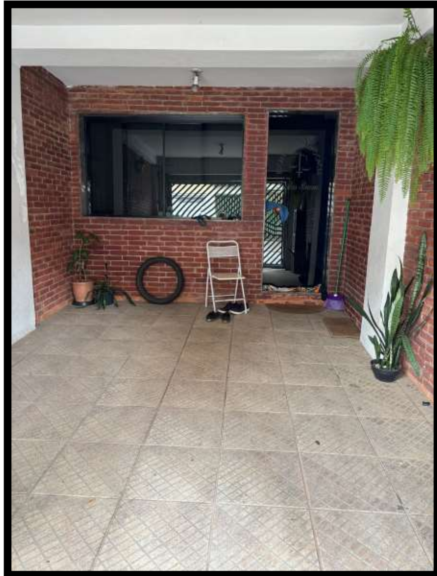
VISTA DA GARAGEM.