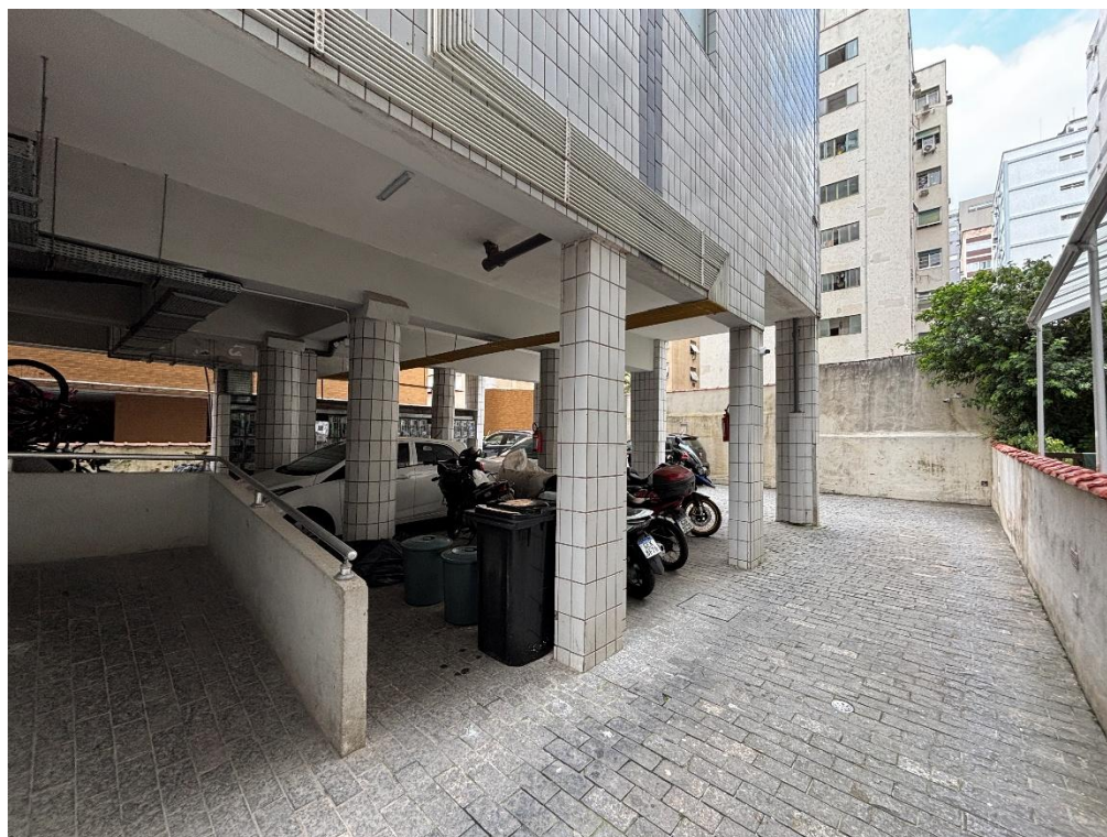
Figura 26 do laudo: Vista da garagem coletiva, com vagas insuficientes para todas as unidades do prédio.

do imóvel não contempla garagem demarcada, tampouco privativa. Aliás, segundo o Sr. Severino, funcionário do prédio, a garagem coletiva do não possui vagas suficientes para todas as unidades.