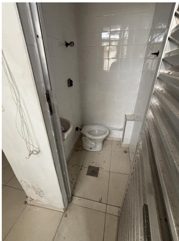
Figura 23: Banheiro da área de serviços.