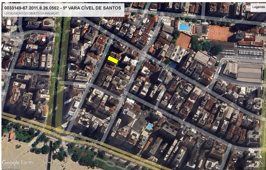
Figura 1: Em amarelo, a localização do imóvel objeto da avaliação.