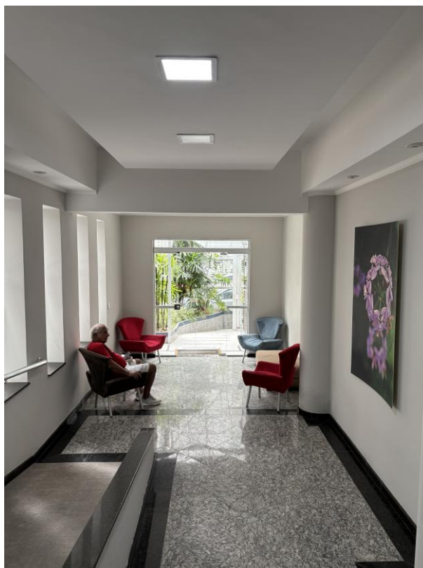
Figura 6: Hall de entrada do condomínio.