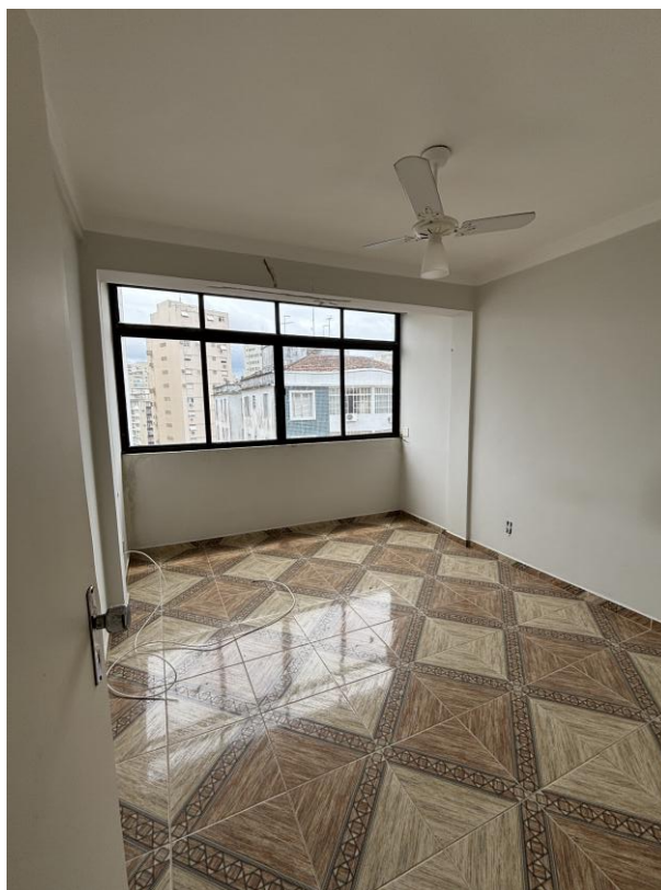
Figura 14: Dormitório 3.