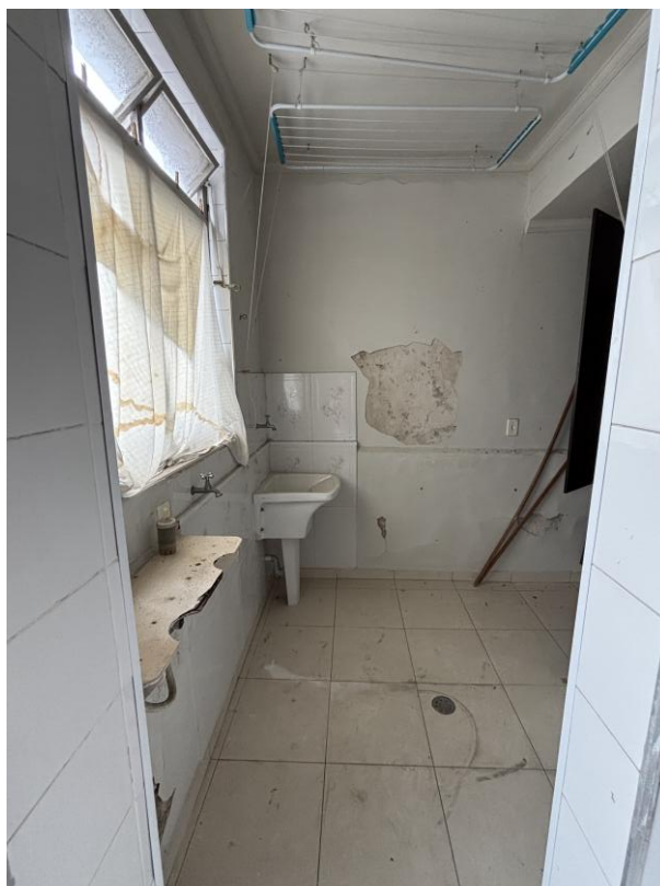
Figura 22: Área de serviços.