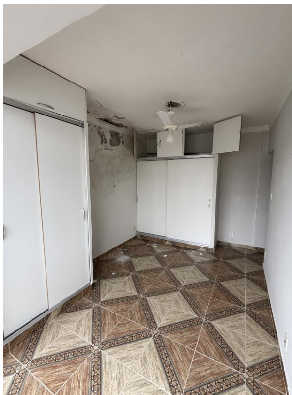
Figura 9: Suíte, outro ângulo.