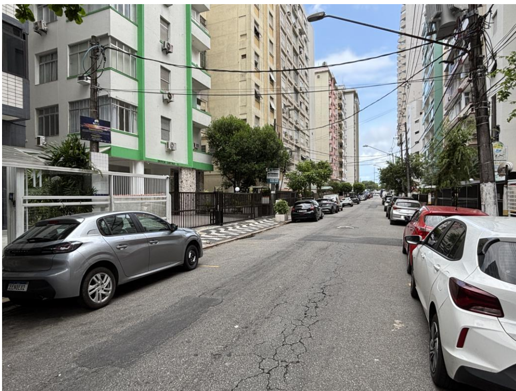
Figura 3: Vista da Rua Pindorama, sentido Rua Lincoln Feliciano.