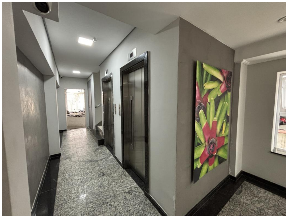
Figura 7: Hall de elevadores.