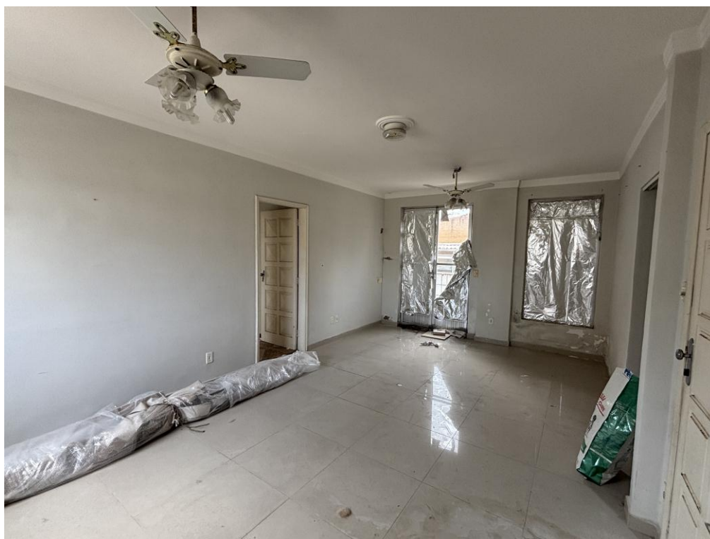
Figura 16: Sala outro ângulo.