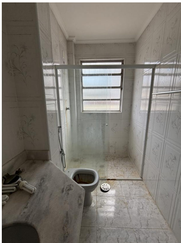
Figura 11: Banheiro social.