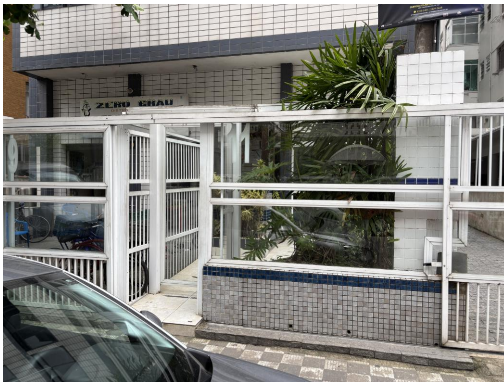
Figura 5: Acesso principal do Edifício Pindorama.