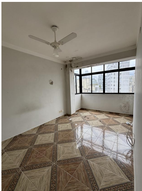
Figura 13: Dormitório 2.