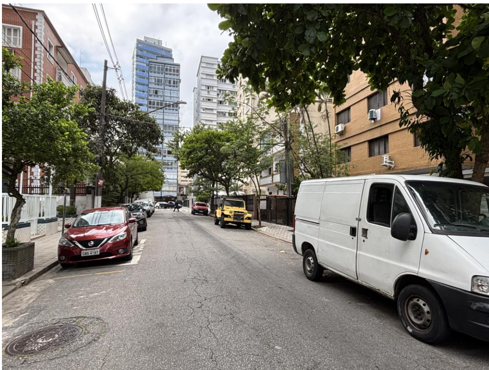
Figura 4: Vista da Rua Pindorama, sentido Rua Governador Pedro de Toledo.