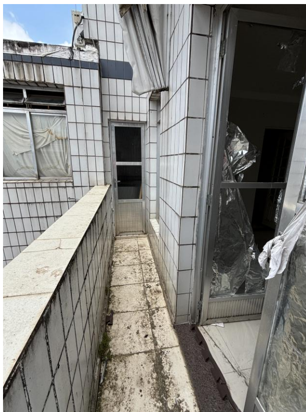
Figura 17: Varanda da sala, conjugada com a cozinha.