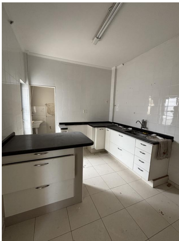
Figura 18: Cozinha.