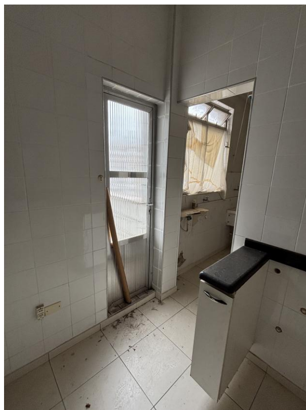
Figura 20: Acesso a área de serviços e varanda conjugada com a sala.