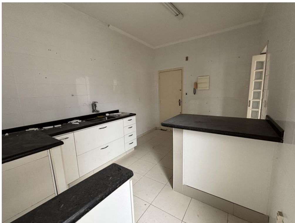
Figura 19: Cozinha sob outro ângulo.