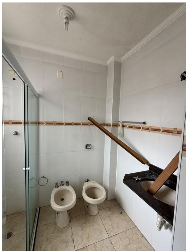
Figura 10: Banheiro privativo da suíte.