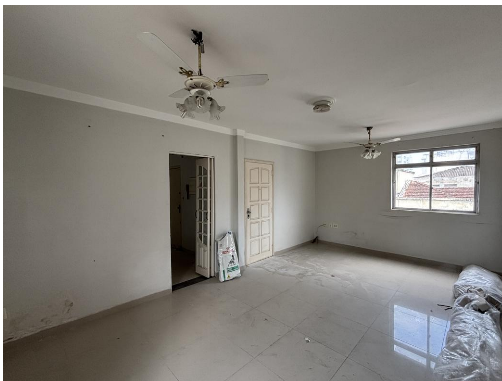
Figura 15: Sala.