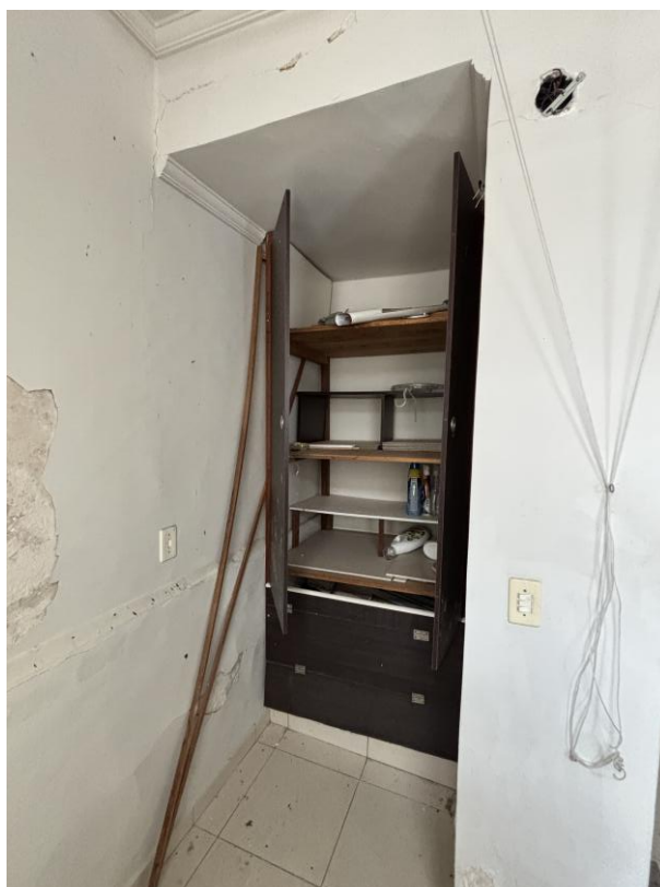
Figura 24: Área de despensa.