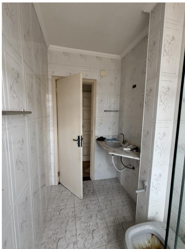
Figura 12: Banheiro social, outro ângulo.