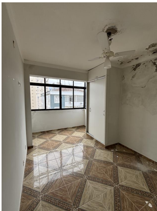
Figura 8: Vista da suíte.