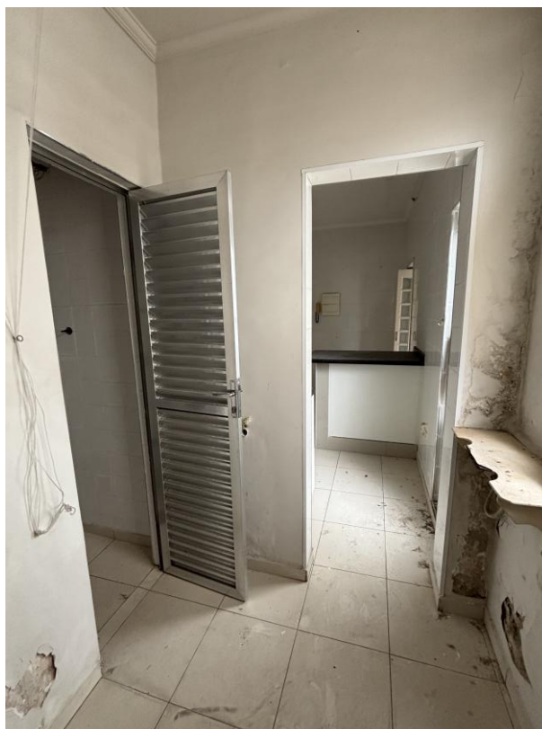
Figura 25: Outro ângulo da área de serviços.