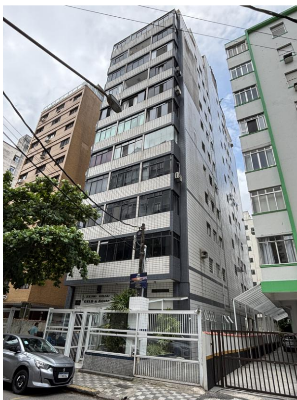
Figura 2: Vista geral do Edifício Pindorama.

Avenida Conselheiro Nébias, 754, sala 1401, Boqueirão, Santos-SP, CEP 11045-002 Telephone: 55 13 3326-0239 | E-mail: lisboapericia@gmail.com