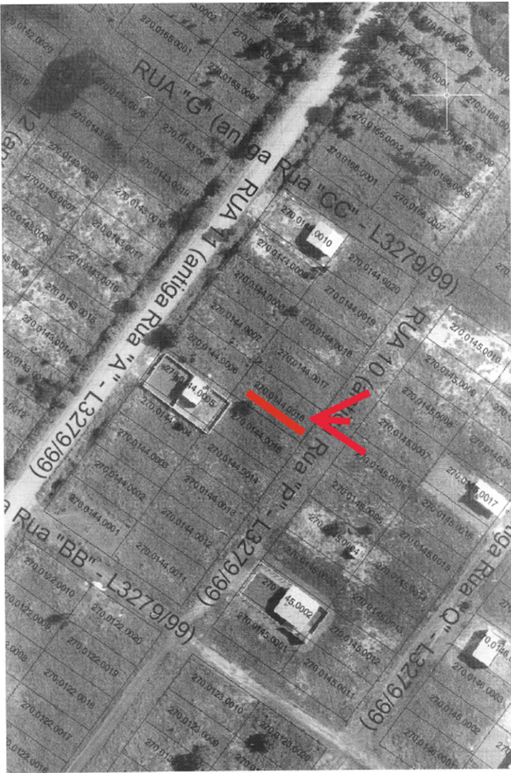
MAPA ADMINISTRATIVO fornecido pela Prefeitura: