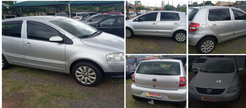
Volkswagen Fox Plus 1.6mi/ 1.6mi Total Flex 8V 4P 2009

A seguir, apresentam-se alguns anúncios de veículos do mesmo ano e modelo, os quais se encontram em bom estado de conservação e funcionamento: