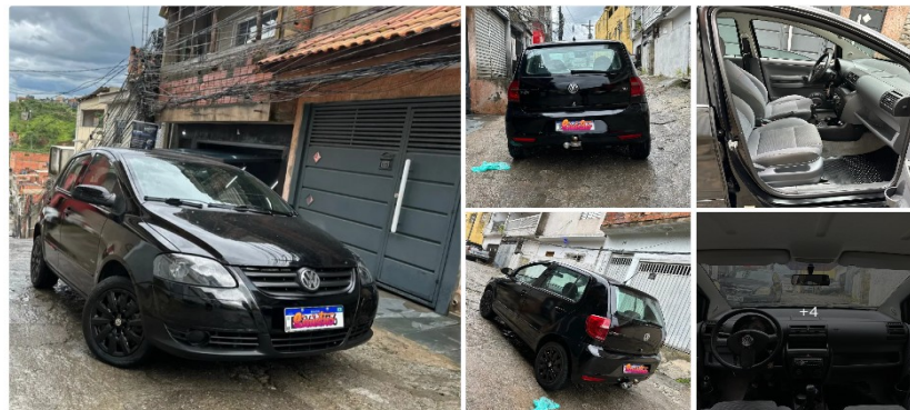
Volkswagen Fox Plus 1.6mi/ 1.6mi Total Flex 8V 4P 2009