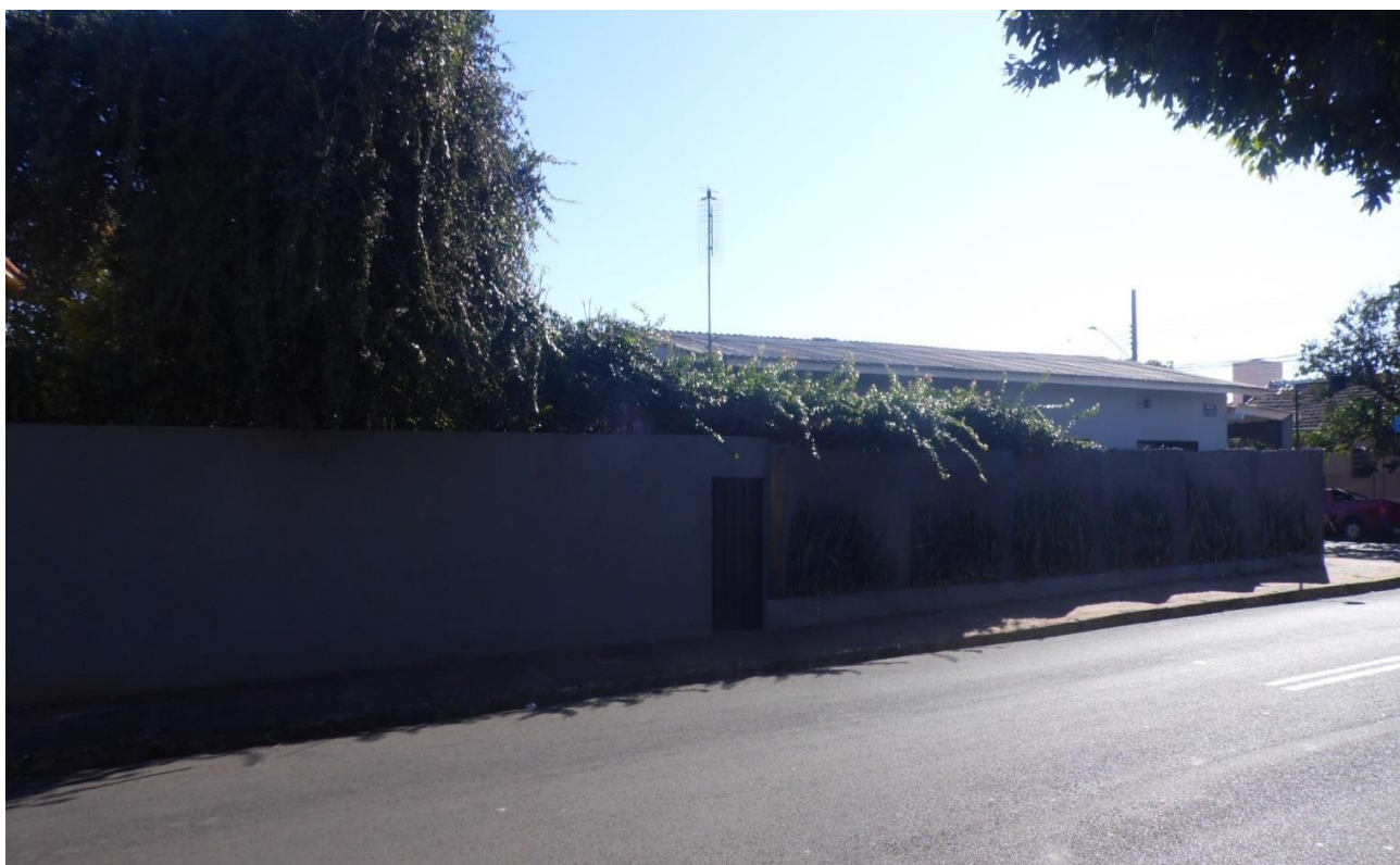
Imagem 04 – Além das construções/benfeitorias edificadas no imóvel também foi constatado um amplo quintal na parte dos fundos, outro fator que agrega valor ao imóvel, valorizando-o.