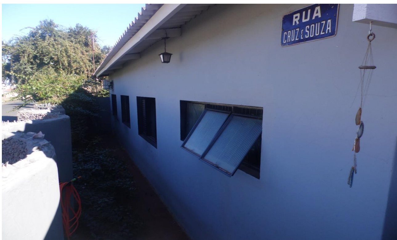
Imagem 06 – Mesmo não sendo possível acessar o interior do imóvel, foi constatado que a pintura externa foi revisada e não há nenhuma fissura ou trinca, imóvel em boas condições.