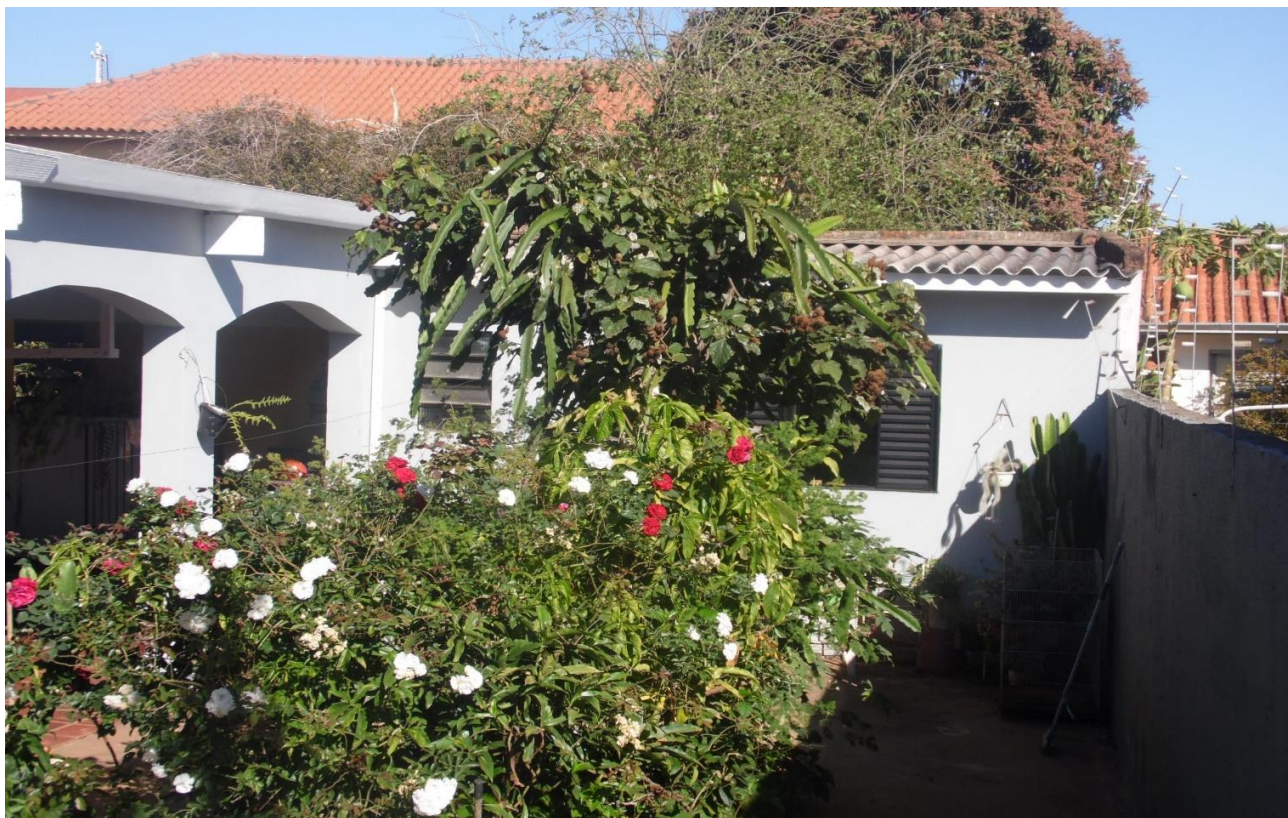
Imagem 09 – Edícula - foi constatado um padrão construtivo similar ao da residência principal.