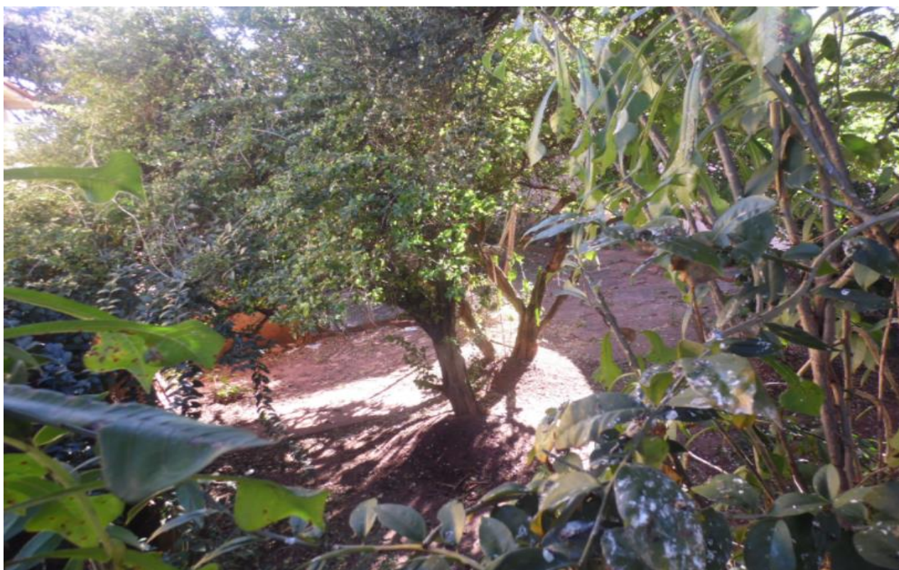
Imagem 10 – Quintal - conforme já esclarecido ter um amplo quintal na parte dos fundos é um fator que valoriza o imóvel, principalmente quando levado em consideração a sua localização.