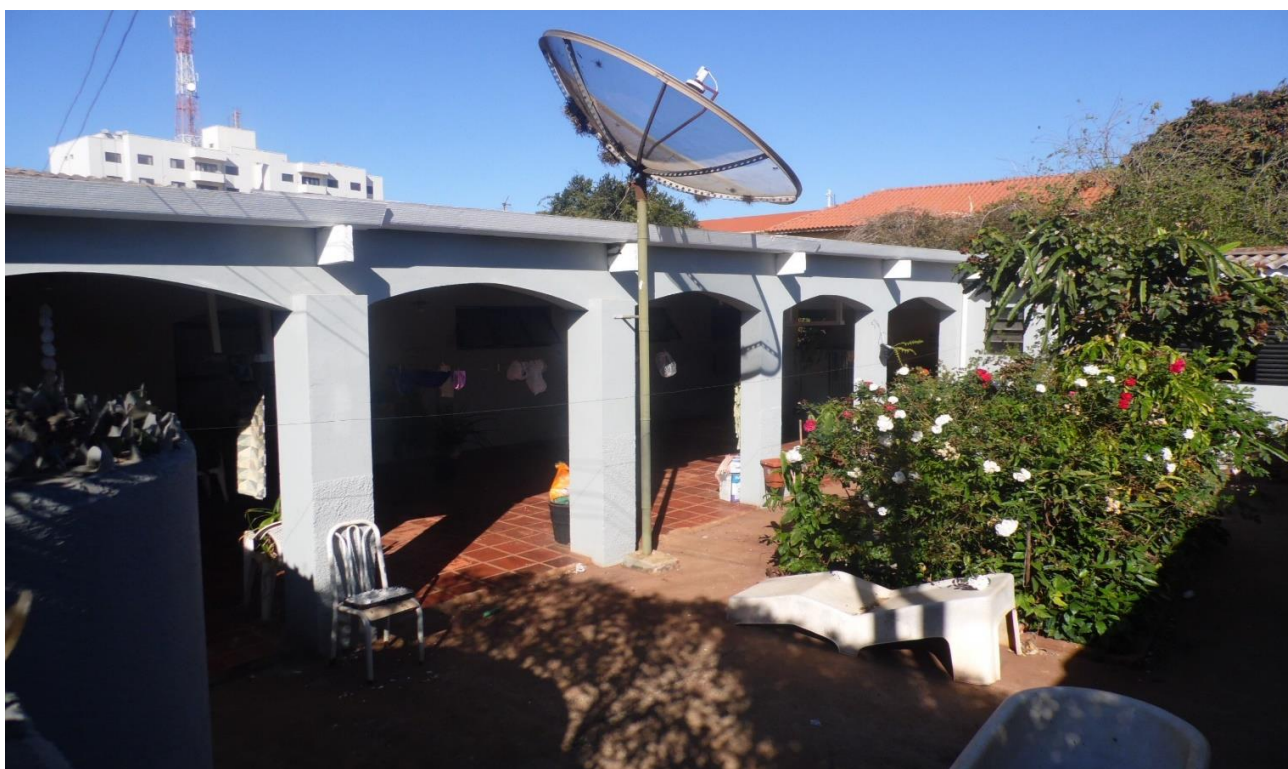
Imagem 08 – Lateral direita - em primeiro plano, o Abrigo para Veículos, e, ao fundo, a Edícula em alvenaria, construções/benfeitorias edificadas no imóvel que estão em boas condições.