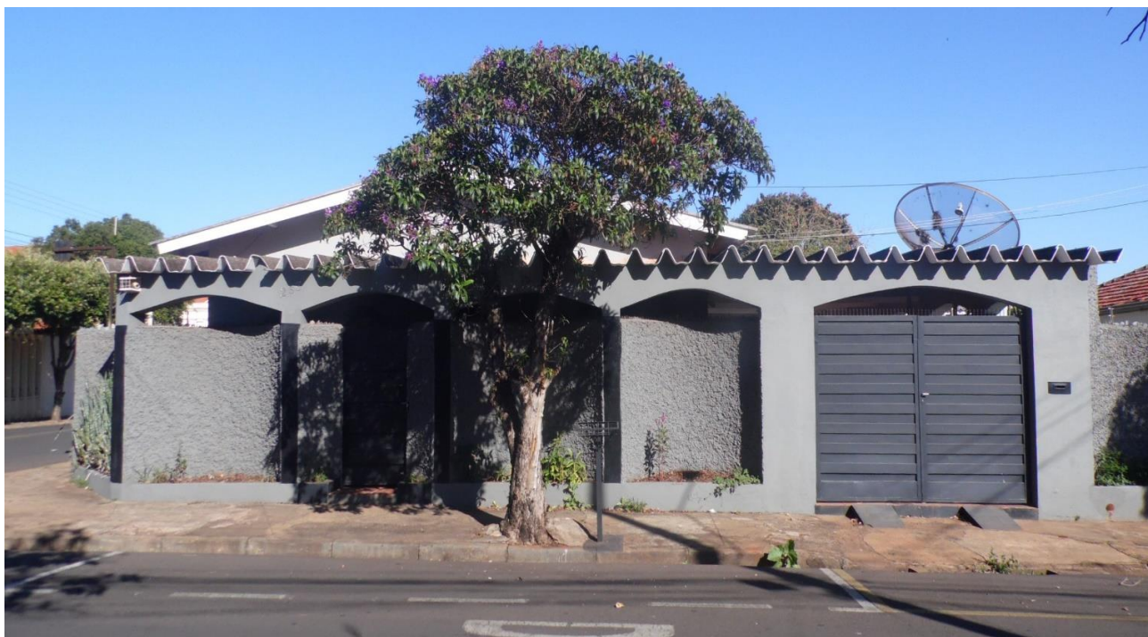
Imagem 01 – Fachada do imóvel - Rua Cruz e Souza, n° 263, esquina com a Rua São Paulo, Vila Xavier, Assis-SP, terreno com 569.75 m2 registrados na Matrícula e topografia plana.