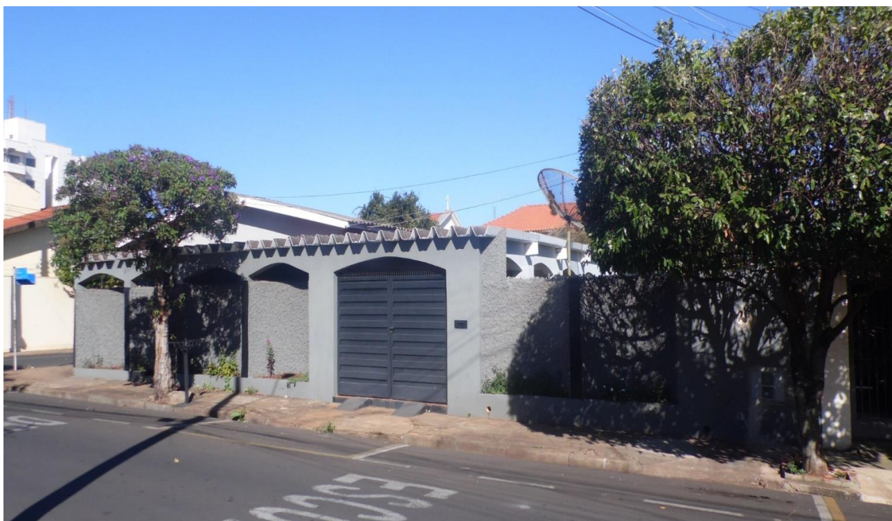
Imagem 02 – A Vila Xavier é um bairro predominantemente residencial, conta com uma boa infraestrutura urbana e possui uma localização privilegiada, fatores que valorizam o imóvel.