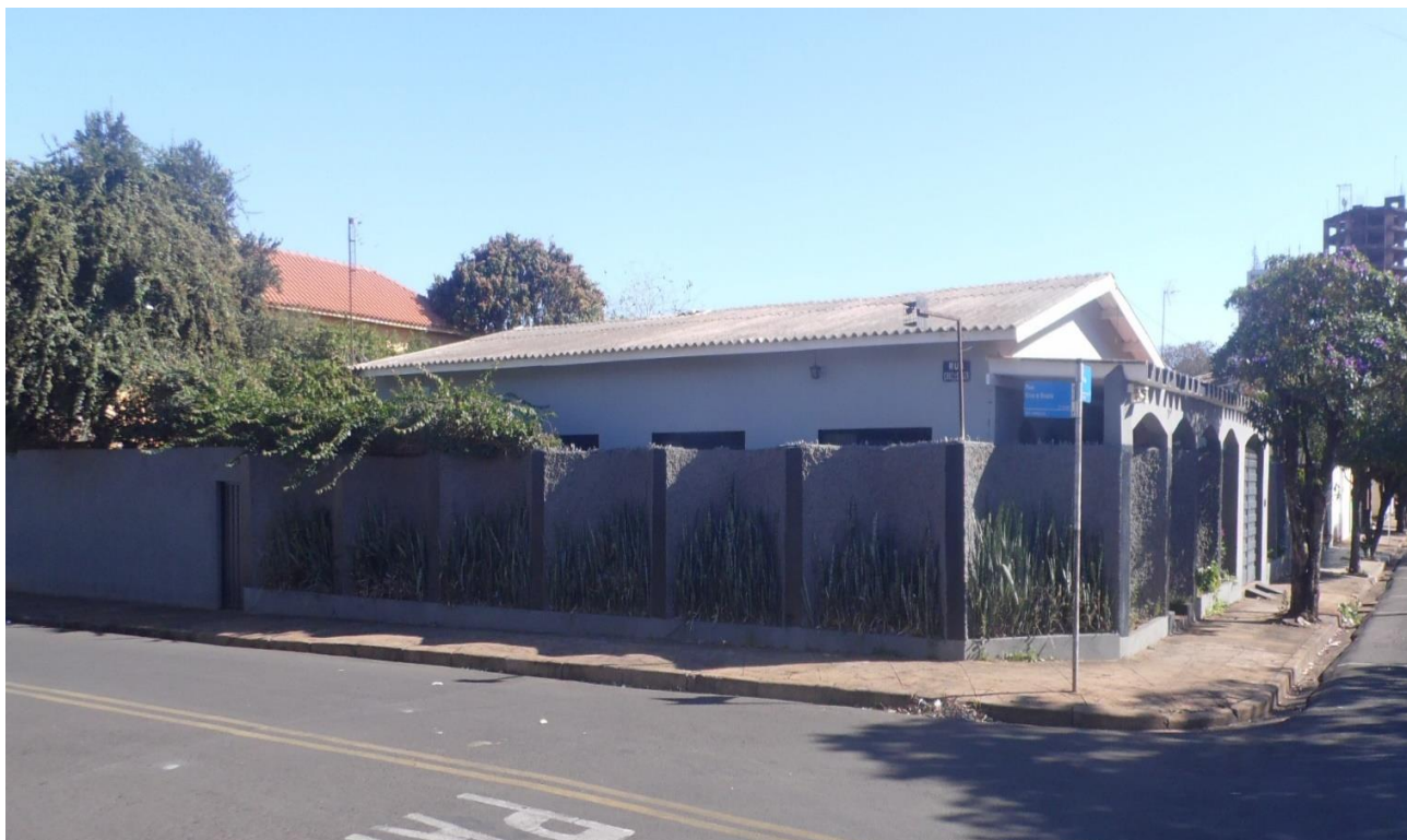
Imagem 03 – Vista lateral - foram constatadas duas construções/benfeitorias no imóvel, uma residência principal com área construída de 118.00 m2 e uma Edícula com área de 111.00 m2.