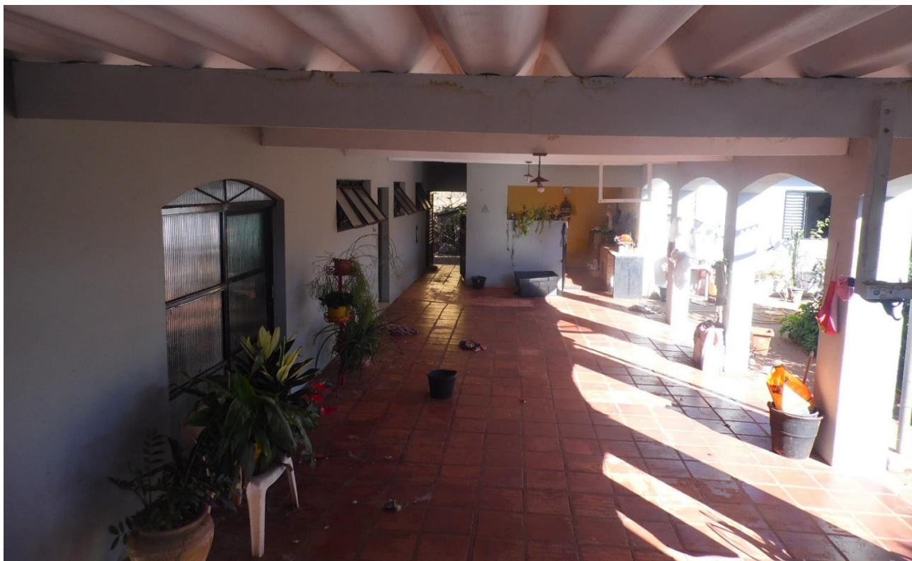
Imagem 07 – Mesmo não sendo possível acessar o interior do imóvel, foi constatado que ele está, de maneira geral, em boas condições em relação a conservação/manutenção.