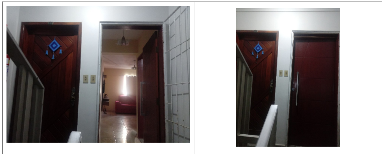
Frente (entrada do apartamento)