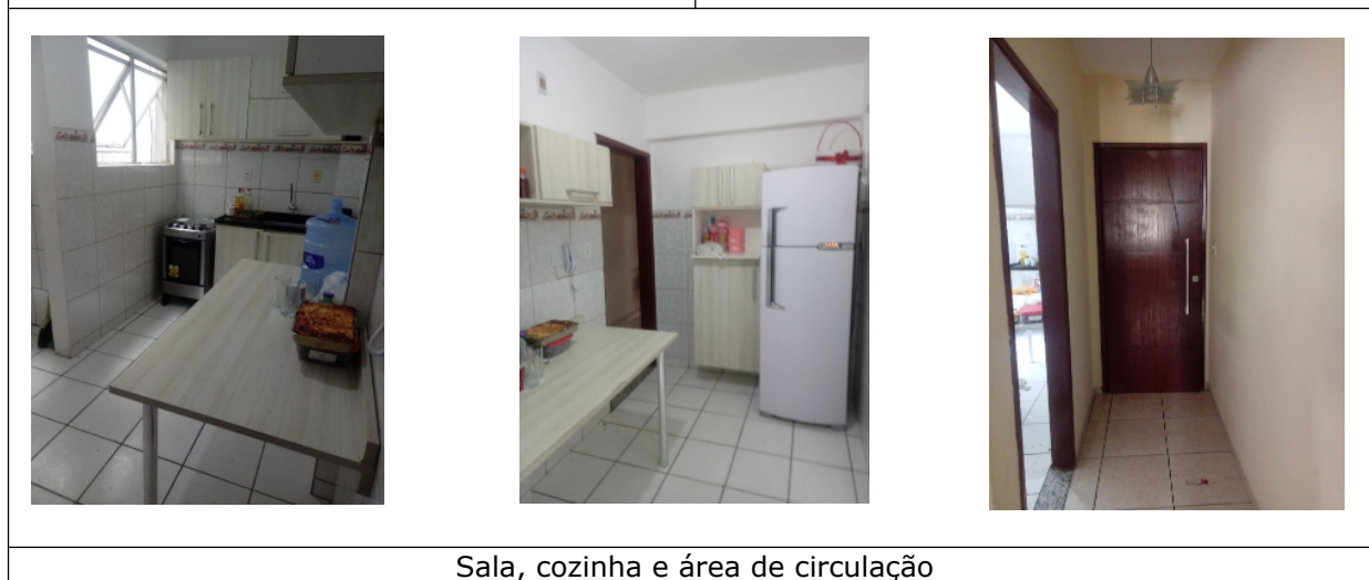
Sala, cozinha e área de circulação