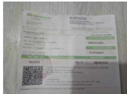
Área de serviço e despensa (antigo "quarto de empregada") Comprovante de residência/conta de energia