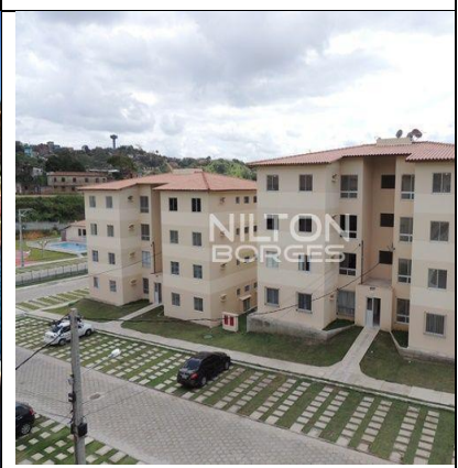
Vista frontal dos apartamentos