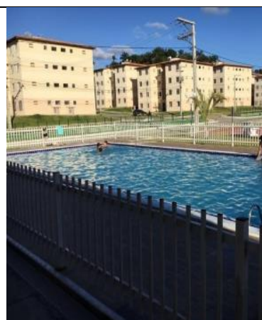
Área de uso comum: deck com piscina