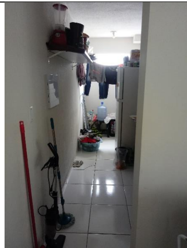
Área de circulação